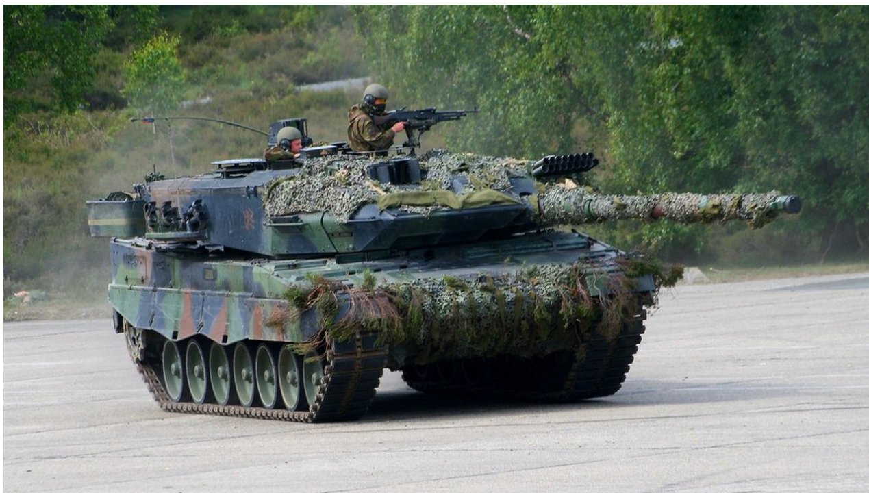
Tank Leopard 2A6M holandské armády

Vlády Nizozemska a Dánska odmítly předat hlavní bojové tanky Leopard 2 ukrajinským silám.