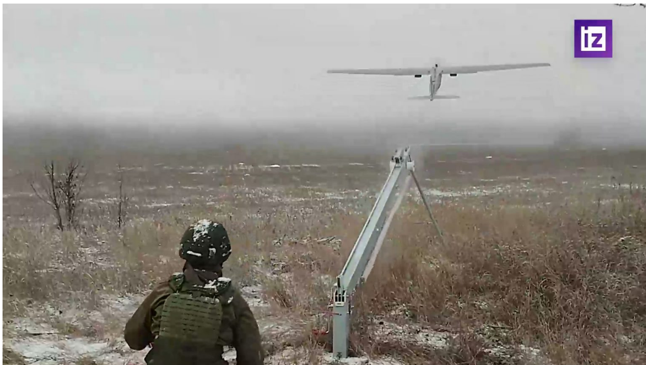
Start UAV "Orlan-10" se dvěma závěsnými kontejnery pro shození munice

Dron je vyzbrojen čtyřmi vysoce výbušnou tříštivou municí ve dvou zavěšených automatických kontejnerech. Zaměřování cíle se provádí podle zadaných souřadnic v automatickém režimu.