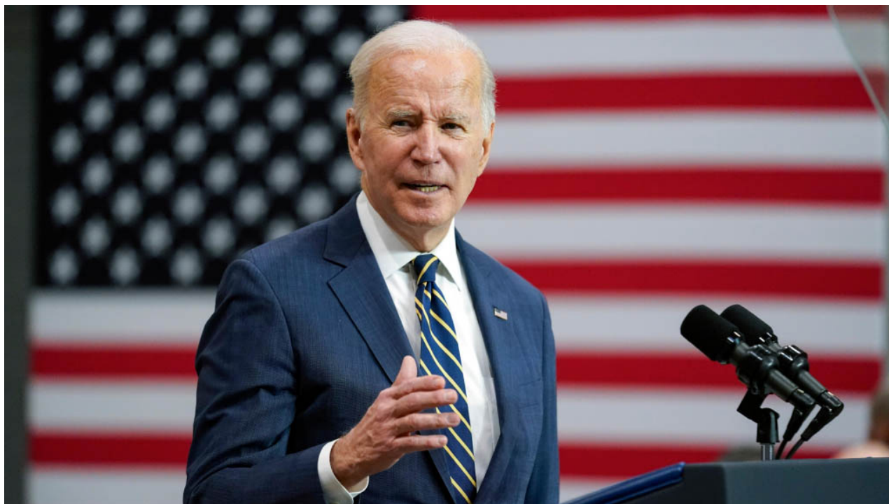
americký prezident Joe Biden

Americký vůdce poznamenal, že tanky Abrams jsou poměrně náročné na používání a údržbu, takže ukrajinská armáda bude mít k dispozici náhradní díly a další potřebné vybavení.