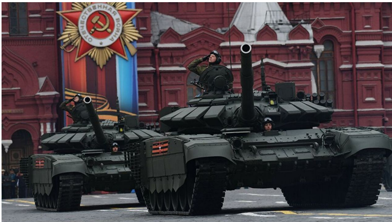
Tanky T-72B3M na přehlídce 9. května v Moskvě.

Objevilo se video bojového použití modernizovaného hlavního bojového tanku T-72B3M tankery Jižního vojenského okruhu k potlačení nepřátelských palebných bodů během speciální vojenské operace.