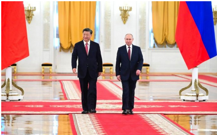
Nové tandemové řízení globalistů. Putin zastupující západní civilizaci. Xi zastupující východní civilizaci.

Pokud se Trumpovi nepovede tento plán a pokud Rusko na něj nepřistoupí, tak prostě tento Plán A zkrátka a jednoduše selže. A v tom okamžiku přijde na řadu druhý plán, o kterém si musíme něco říct. Tento druhý plán je tzv. nemyslitelnou koncovkou za starým světovým řádem, koncovkou v podobě III. sv. války. Druhý plán totiž spočívá v posílení intenzity ukrajinského vyzbrojování, a to raketami strategického určení s plochou dráhou Tomahawk a spolu s nimi poskytnutí jaderných taktických hlavic Ukrajině.