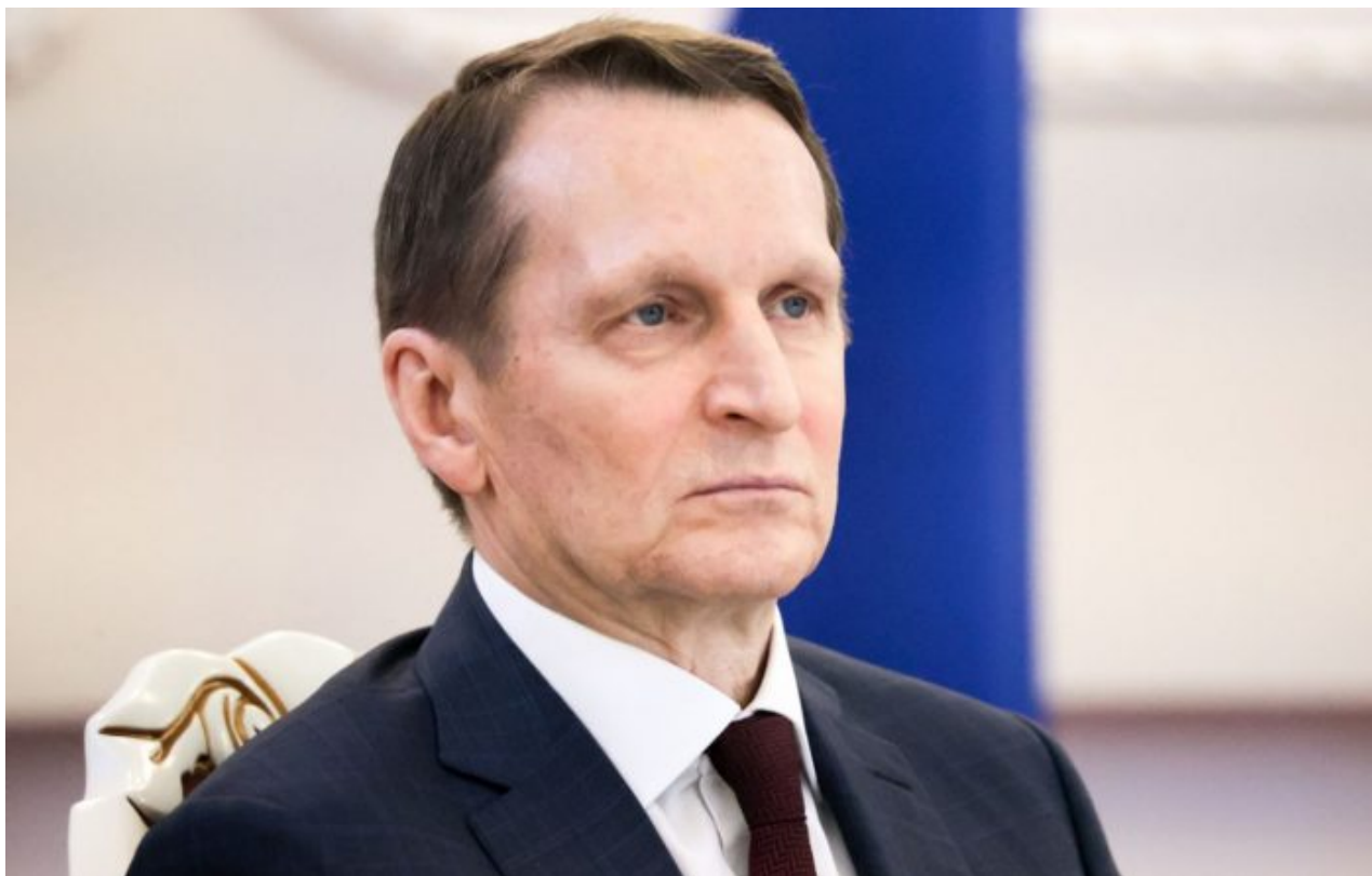
Sergej Naryškin, ředitel zahraniční rozvědky (SVR)

V pátečním prohlášení špionážní agentura s odvoláním na zpravodajské zdroje uvedla, že NATO je stále více nakloněno zastavení bojů na současné frontové linii, protože vojenský blok vedený USA a Ukrajina si uvědomily, že se jim nedaří způsobit “strategickou porážku” Rusku. Zmrazení konfliktu by Západu umožnilo obnovit rozvrácenou ukrajinskou armádu a “připravit ji na pokus o odvetu” , uvedla SVR. Dále uvedla, že NATO již zřizuje výcviková střediska pro zpracování nejméně jednoho milionu ukrajinských branců během této tzv. mírové mise.