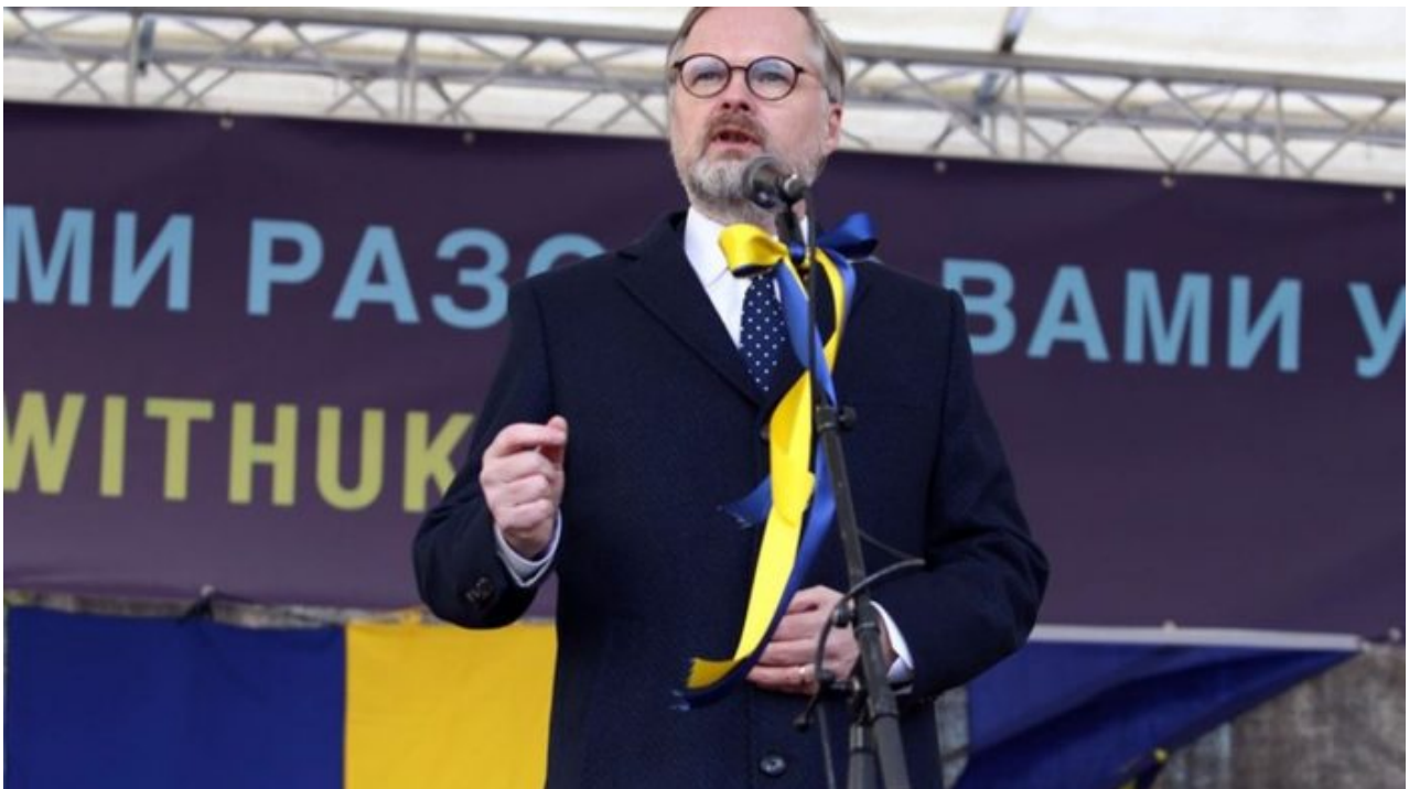
Petr Fiala na propagandistické akci k podpoře zbrojních dodávek pro Ukrajinu v březnu 2022

Bylo zcela evidentní, že na ČT nesmí o Ukrajincích zaznít nic negativního, což je podle našich informací přímo nařízení Fialovy vlády směrem k ČT. Není dovolena žádná kritika Ukrajinců, nic negativního o Ukrajincích ve spojení s kriminalitou. A proč tato epizoda z České televize je tak klíčová? Protože nasunutí Ukrajinců do ČR bez bezpečnostních prověrek zkrátka dovedlo města a magistráty v ČR k obrovské bezpečnostní krizi a k obrovské vlně kriminality , kterou např. Plzeň už prostě nezvládá a zoufale se obrací s žádostí o pomoc na Prahu, vnitro a obecně na Fialovu vládu.