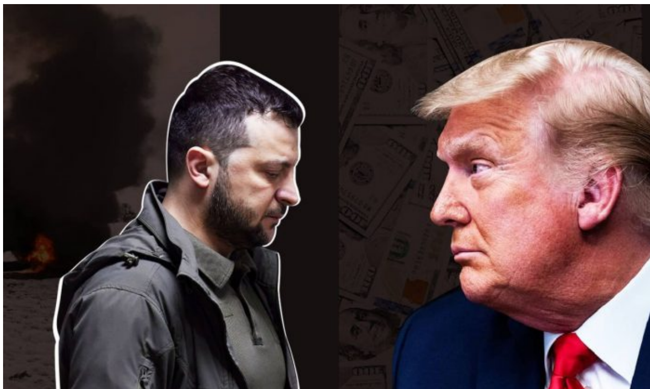
Trumpův plán spíše připomíná vydírání obou stran konfliktu

V návrhu se podle SVR jasně deklaruje, že USA nesmí být postaveny do pozice přímého jaderného střetu s Ruskem, ale současně se v dokumentu uvádí, že nic jiného, než rozmístění jaderného odstrašení na Ukrajině prostě Ruskou armádu nezastaví v postupu. A rovněž je v dokumentu prý uvedeno datum 30. března 2025 jako referenční datum pro stanovení demarkační linie.