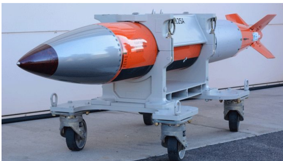
Americká bomba B-61 s jadernou taktickou hlavicí

Představitelé USA a Evropské unie prý zvažují [1] poskytnutí jaderných zbraní Ukrajině formou daru, přičemž tyto jaderné zbraně by měly být odstrašením pro Rusko před pokračováním dalších vojenských operací na Ukrajině poté, co USA pod vedením Donalda Trumpa omezí anebo úplně ukončí svoji podporu Ukrajině. Tyto jaderné zbraně by Ukrajině mohl poskytnout Joe Biden, a to ještě předtím, než se Donald Trump ujme 20. ledna příštího roku moci v Bílém domě.