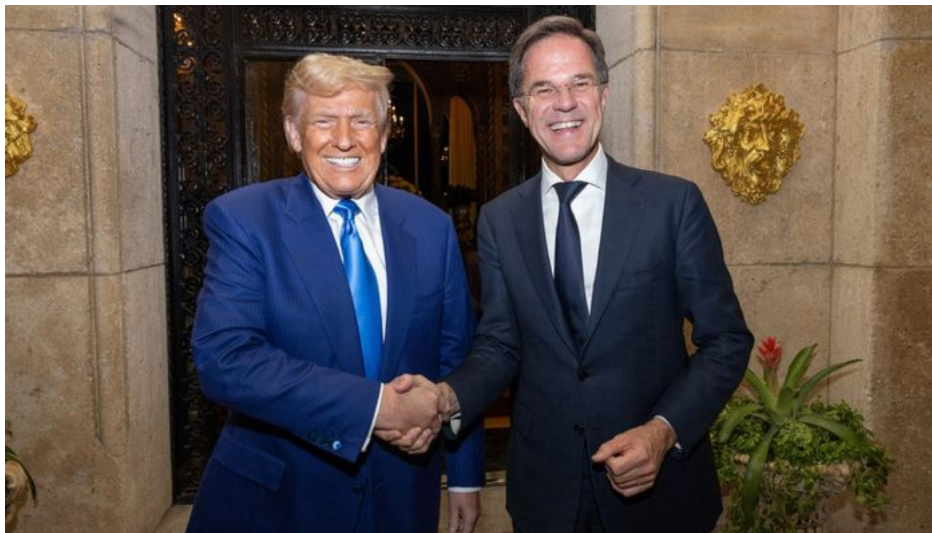
Mark Rutte v Trumpově vile Mar-a-Lago v Palm Beach na Floridě

Jedinou variantou, jak zastavit postupující Rusy, je proto jaderné odstrašení. Nic jiného na Ukrajině totiž už Rusy nezastaví. To je prostě realita. A celý děsivý obraz uzavírá něco, co se odehrálo již minulý pátek. Největší válečný jestřáb v NATO a současný generální tajemník aliance Mark Rutte totiž minulý pátek přiletěl na Floridu na bleskovou schůzku s Donaldem Trumpem v Mar-a-Lago resortu.