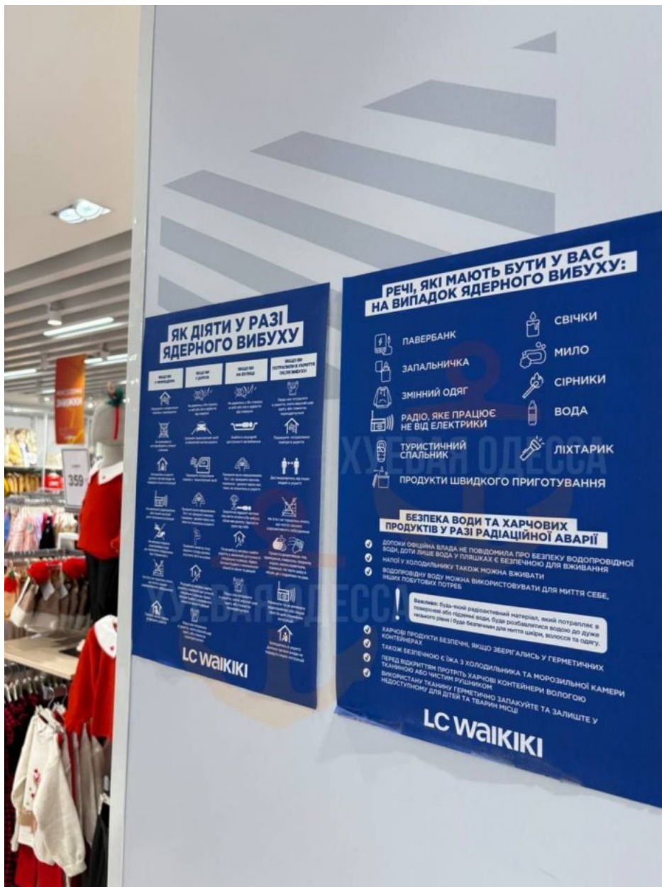
Instrukce jaderné přípravy pro občany ve vchodech do ukrajinských obchodů

Ukrajinci již Rusy nezastaví, nemají na to vojáky ani zbraně, a nezastaví je ani jalová vojska NATO. Zastaví je pouze jaderné odstrašení, které poskytnou jednotky francouzské a britské armády na Ukrajině. Ukrajina nevstoupí do NATO, ale NATO vstoupí na Ukrajinu! Ruský postup se zastaví jadernou hrozbou rozmístěnou pod kontrolou NATO na Ukrajině! Jenže, opravdu si někdo myslí, že Kreml se nechá zastavit v osvobozování ruských území na Ukrajině, které Moskva považuje za svá etnická historická území?