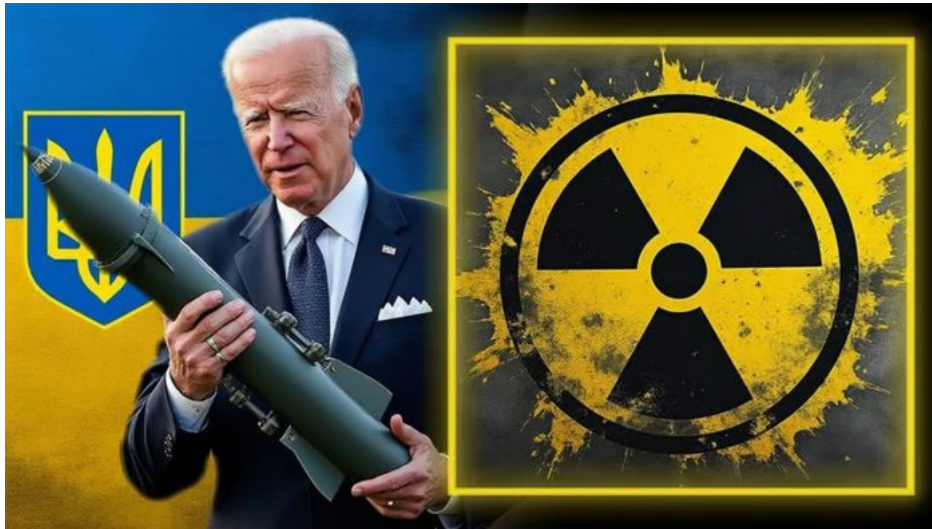
Šílený Biden nejprve povolil střílet rakety na Rusko a teď možná poskytne Ukrajincům jaderné zbraně

A jak se zdá, Rutte prostě narychlo letěl minulý pátek za Trumpem, aby mu tlumočil, o čem se jednalo den předtím ve čtvrtek mezi Paříží a Londýnem, tedy o vyslání vojáků na Ukrajinu a o poskytnutí jaderných zbraní Ukrajině na vytvoření jaderných strašáků, které se zapíchnou do půdy na čáře frontového doteku na Ukrajině. A výměnou za to Ukrajina splní požadavek Kremlu a nevstoupí do NATO. Proběhne to totiž naopak – NATO vstoupí na Ukrajinu.