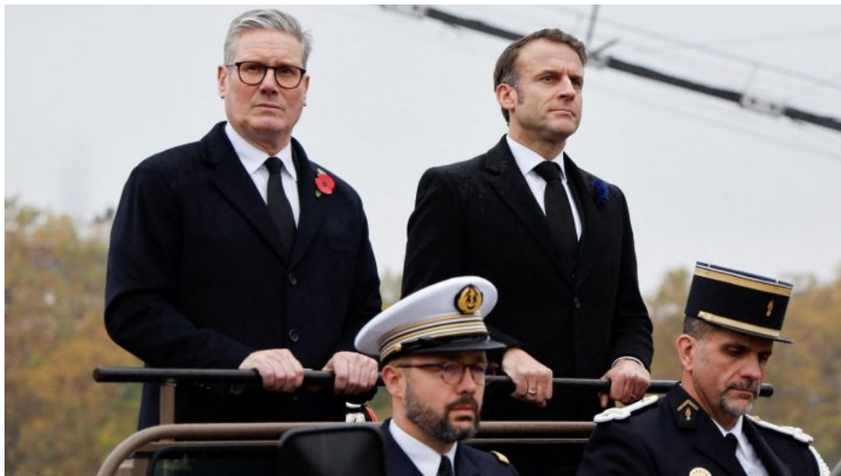
Keir Starmer a Emmanuel Macron

Podle pondělní zprávy [2] deníku Le Monde se Velká Británie a Francie zabývají myšlenkou nasazení evropských vojenských sil na Ukrajině, aby bojovaly přímo proti Rusku. “S tím, jak konflikt na Ukrajině vstupuje do nové fáze eskalace, byly oživeny diskuse o vyslání západních jednotek a soukromých obranných společností na Ukrajinu, Le Monde se dozvěděl z důvěryhodných zdrojů,” uvedl Le Monde v pondělí.