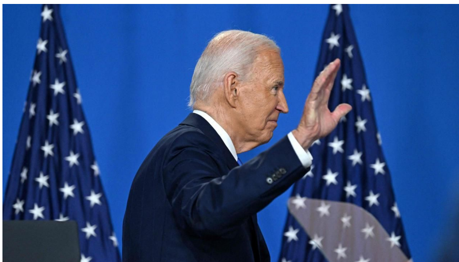
Biden by ještě před odchodem z Bílého domu mohl dovolit rozmístění jaderných hlavic na Ukrajině

Americké špiónážní agentury prý vyhodnotily, že urychlení dodávek zbraní, munice a materiálu pro Ukrajinu v krátkodobém horizontu příliš nezmění průběh války, jak uvedli američtí představitelé, kteří byli seznámeni se zpravodajskými informacemi. Jedinou zlatou bezpečnostní zárukou, kterou Ukrajina chce, je pozvání do NATO. To se jí však za Bidena nepodařilo a za Trumpa je pozvání nepravděpodobné. Američtí a evropští představitelé proto diskutují o odstrašení jako možné bezpečnostní záruce pro Ukrajinu, například o vytvoření dostatečných zásob konvenčního arzenálu, aby bylo možné zasadit trestný úder, pokud by Rusko porušilo příměří.