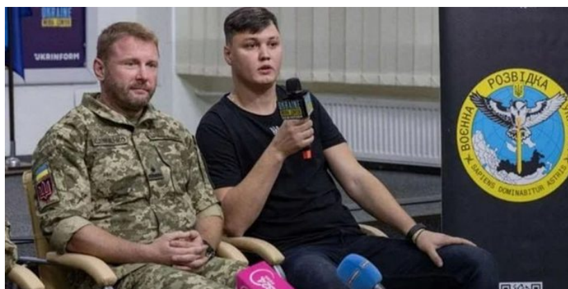
Maxim Kuzminov na ukrajinské televizi (vpravo)

Nejenom, že posílají Ukrajině raketometry a drony, se kterými potom ukrajinské teroristické útvary útočí na ruské civilní cíle v rozporu s Vídeňskou konvencí, ale nyní se ukázalo, že ČR se měla stát zemí, která ukryje zrádce a teroristu, který otrávil svoji vlastní posádku, aby mu nebránila v provedení únosu helikoptéry na Ukrajinu. Pokud by zmíněný pilot nebyl vlastenec a kádrově uvědomělý, a pokud by se zachoval jako Kuzminov, potom by skončil v ČR i s rodinou pod krytím ukrajinského uprchlíka a ruská GRU by po něm zahájila pátrání.