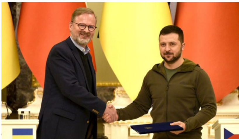
Petr Fiala a Volodymyr Zelenský

To je stylové pro Fialovu mafiánskou vládu, ne? Mafiáni si podají ruku s teroristy na území ČR! Nejhorší na celé věci je, že rok 2025 vypadá, že celá situace eskaluje do války s Ruskem a Trumpův mír nikam nepovede. Signály z USA, které začínají přicházet, ukazují a potvrzují, že Trumpův mír je vlastně špatně pochopený od samotného počátku. Trump prostě stáhne USA z participace na válce na Ukrajině a přenechá válku dál běžet na účet 27 zemí EU. A ty válku neukončí, dokud ekonomicky alespoň největší země EU nepadnou na hubu a volby v těch zemích neodstraní jejich vlády do moci. Taková je projekce roku 2025.