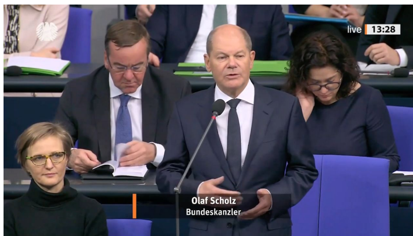
Olaf Scholz, spolkový kancléř

Když ty náklady na válku na Ukrajině, do kterých počítejte nejen peníze, ale především západní sankce na Rusko, které ničí evropský průmysl a evropské ekonomiky, dokáží položit německou vládu, tak logicky to samé bude hrozit i ostatním vládám. Zatímco MSM média se věnují hlavně důsledkům rozvratu vládní koalice v Německu, jenom málo médií a novin se dívá na německé ekonomické problémy z pohledu příčin.