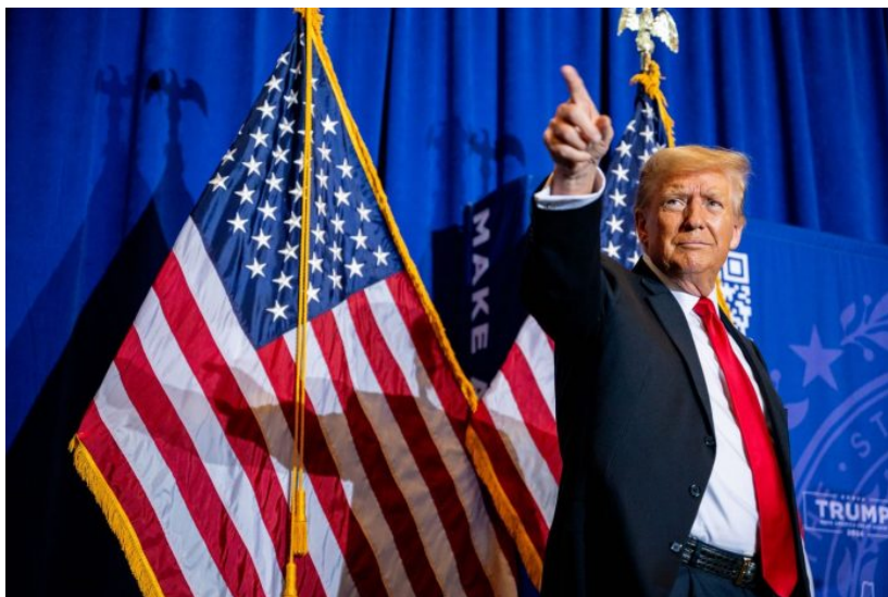
Donald Trump, nově zvolený 47. prezident USA

“Můžeme provádět výcvik a další podporu, ale hlaveň zbraně bude evropská,” řekl člen Trumpova týmu listu Wall Street Journal [4] v rozhovoru. “Nepošleme americké muže a ženy, aby udržovali mír na Ukrajině. A nezaplatíme za to. Ať to udělají Poláci, Němci, Britové a Francouzi.” George Osborne, který byl v letech 2015-2016 prvním ministrem zahraničí v Cameronově vládě, v pátek prohlásil, že není reálné, aby Spojené království po Trumpově vítězství nadále podporovalo Ukrajinu bez podpory USA. “Je realistické očekávat úplné vítězství Ukrajiny, úplné vyhnání Ruska z ukrajinského území? A pokud ne, víte, možná se hodí naši ješitnosti na Západě říkat ‘odvážní Ukrajinci’, ale nejsou to naše děti, kdo umírá,” řekl bývalý kancléř.