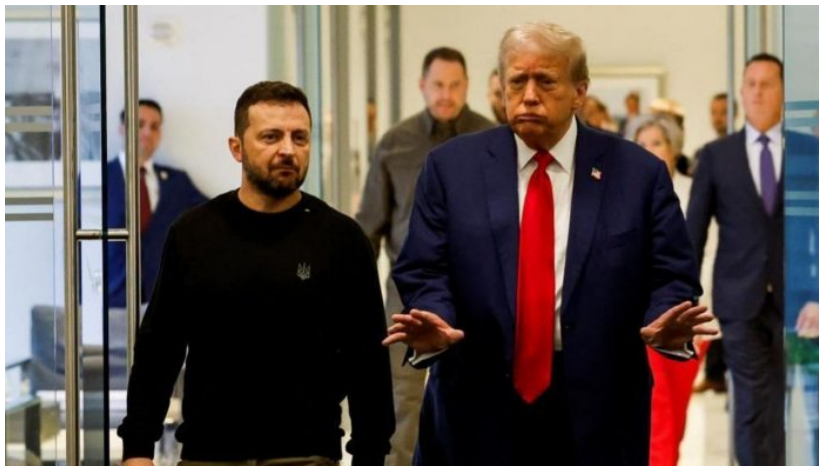
Zelenského setkání s Donaldem Trump v jeho mrakodrapu Trump Tower v New Yorku před americkými volbami

Injekce nějakých 3 miliard EUR odtud z Německa by tak Ukrajině nevydržela ani na měsíční provoz vojenských operací. Většina těchto výdajů je přitom úvěrovaná, a to ještě ani ne jménem Ukrajiny, ale jménem 27 zemí EU, které jsou ručiteli už několika půjček pro Ukrajinu. Proto kolaps Scholzovy vlády přišel v nejvyšší čas. Je to učebnicový příklad toho, jak dopadne země v ekonomických problémech, která si má vybrat mezi vlastní záchranou, anebo pokračováním ve ztracené válce.