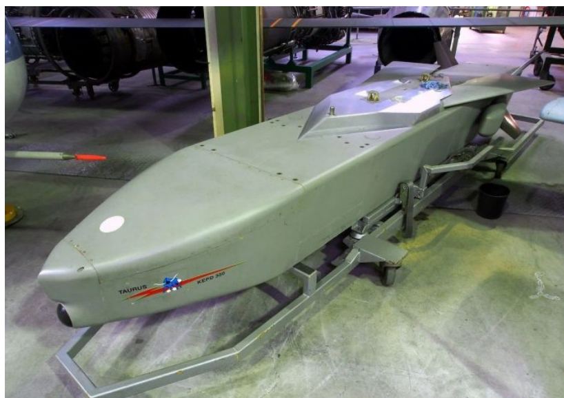
Německá raketa dlouhého doletu Taurus

Ruská ekonomika šlape jako stroj, zatímco ta německá pod protiruskými sankcemi kolabuje a podniky zavírají továrny a propouští zaměstnance. A k tomu všemu Ukrajinci nevyhrávají, oni dokonce ani nepostupují, ani nedrží pozice, oni prostě ustupují. Už od počátku tohoto roku. A to už bude skoro rok, co ustupují. Ustupují i z výletu do Kurské oblasti. Válka na Ukrajině je prohraná, německá ekonomika kvůli sankcím na Rusko sama kolabuje a německá vláda kvůli zoufalému stavu ekonomiky a financí právě padla. Proč je ten rozpad koalice natolik prozaický?