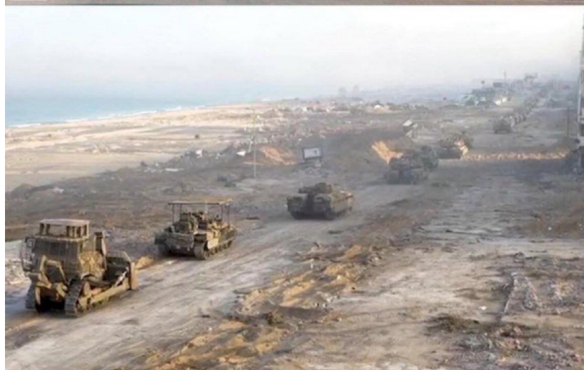
Nejlukrativnější pozemky v Gaze u moře. Všechno je srovnané se zemí a připravené k výstavbě luxusních židovských osad. Nahoře snímek z doby před izraelským útokem

Cílem je zamezení návratu Palestinců do severní části Gazy pomocí metody “spálené země” jako prováděl Wehrmacht a jednotky SS při obsazování Sovětského svazu. Cílem takové taktiky je zabránit původním obyvatelům v návratu, protože když není kam se vrátit, lidé se logicky nevydají na cestu zpět a nevrátí se. Vyšetřovatelé ICC podle informací mají dostatek důkazů i od izraelských vojáků, kteří jsou připraveni svědčit o zvěrstvech a genocidě, kterou dostávali za úkol k provedení od vyššího velení.