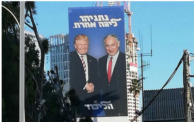
Billboard v Tel Avivu na projev podpory straně Likud a Bibimu ze strany Trumpa

Někteří členové jeho vlády totiž otevřeně prohlašují, že neuznávají existenci palestinského národa, a že Západní břeh by měl být připojen k Izraeli stejně jako Golanské výšiny v roce 2019. Izrael se prý již na anexi připravuje [2] v reakci na pozitivní signály pro takový krok od Donalda Trumpa.