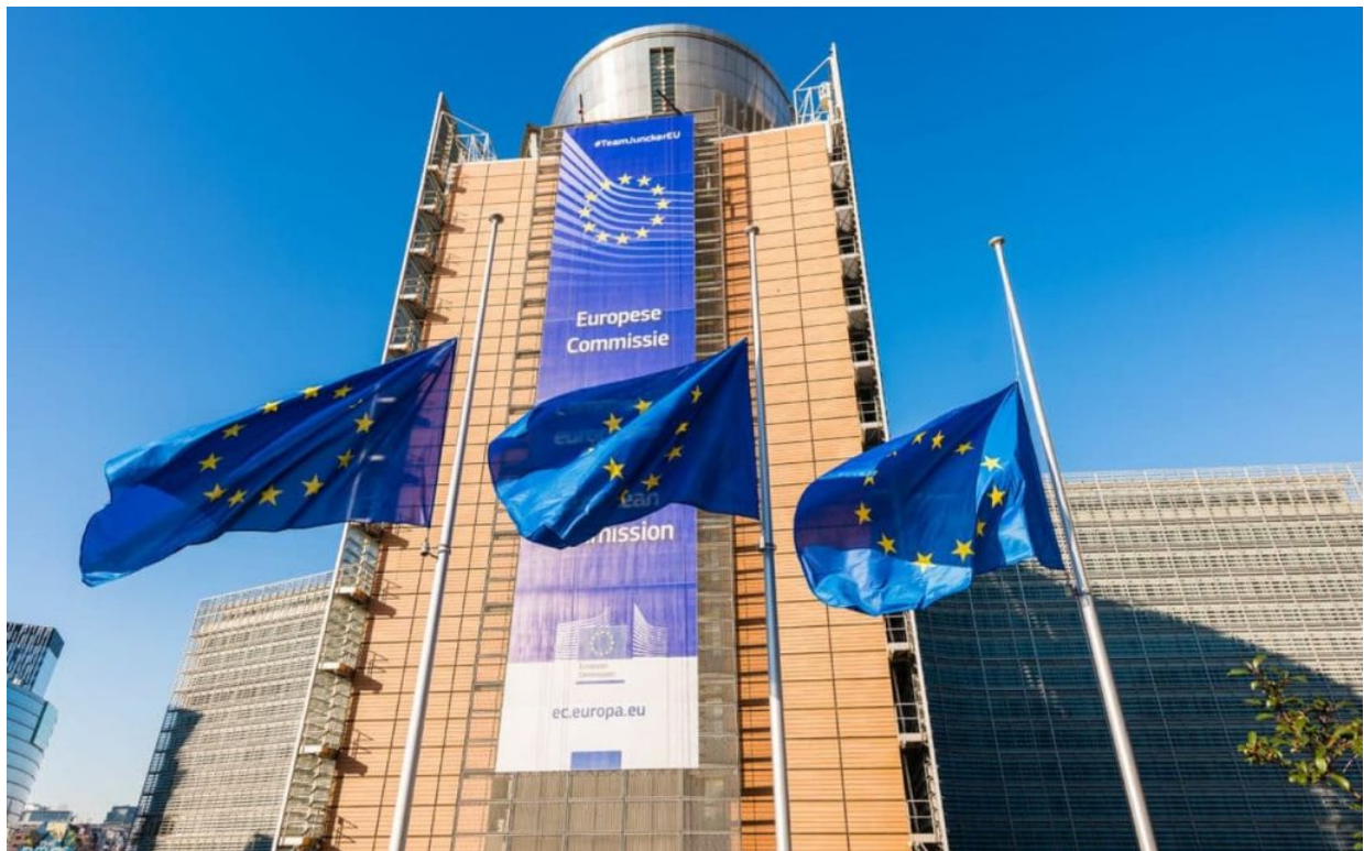
Nejvyšší sovět Eurosojuzu – Sídlo Evropské komise

Potraviny neprodané v komerčním prodeji se prostě přerozdělí a vytvoří se mohutná banka zlevněných potravin, tradičních potravin, se kterými bude možné realizovat nepodmíněný příjem. Především je třeba říct, že zavedení nepodmíněného příjmu nebude nárazová operace, ale několik prvních dekád, očekává se od roku 2030, bude nepodmíněný příjem poskytován dlouhodobě nezaměstnaným.