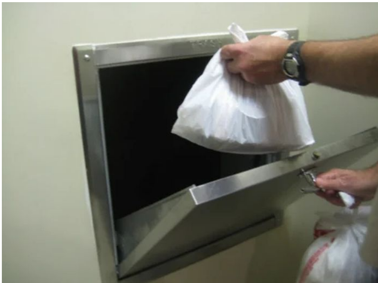
Garbage Chute pro vyhazování odpadu ve výškové budově

Nepoužitá a prošlá potravinová zbytková směs začali Korejci mixovat v mixérech a poté takto rozmixované potraviny začali splachovat do záchodů. Jako v USA. Ti movitější si rovnou do kuchyňského dřezu pořídili drtič odpadu, který vlastně zajistí to samé jako mixér a navíc s mnohem vyšším drtícím výkonem, než jaký nabízí stolní kuchyňský mixér. Do doby zavedení pokut za potraviny v pytlích na odpad v roce 2013 prakticky nikdo drtiče odpadu v Jižní Koreji nepoužíval. Mimochodem, je dobré uvést, že Američané likvidují potraviny už prakticky od 50. let minulého století, kdy se rozšířili v USA kuchyňské drtiče odpadu, které bez problému rozdrtí i hovězí kosti.