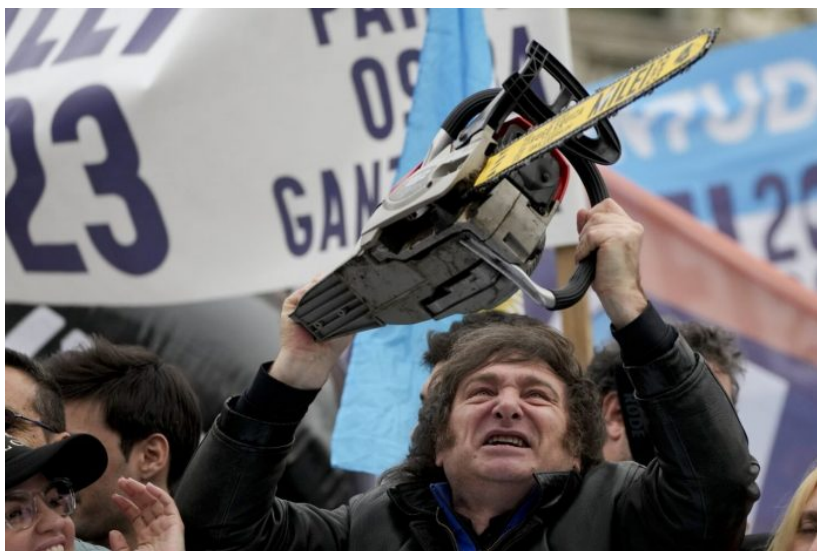
Kromě Trumpa chtěl ministerstvo školství zrušit i Javier Milei, nový prezident Argentiny, který kandidoval s motorovou pilou

Před tzv. Carterovou reformou patřilo americké státní školství paradoxně mezi jedno z nejzaostalejších ve světě a státní osnovy ministerstva sjednotily požadavky na vzdělání ve všech státech. Pokud by Trump chtěl školství očistit od deviatury a alfabetových agend, tak prostě by do čela ministra dosadil vlastence a podporovatele tradiční rodiny. Ten by zrušil úchylné vzdělávací programy, zrušil by smlouvy s neziskovkami a šmitec.