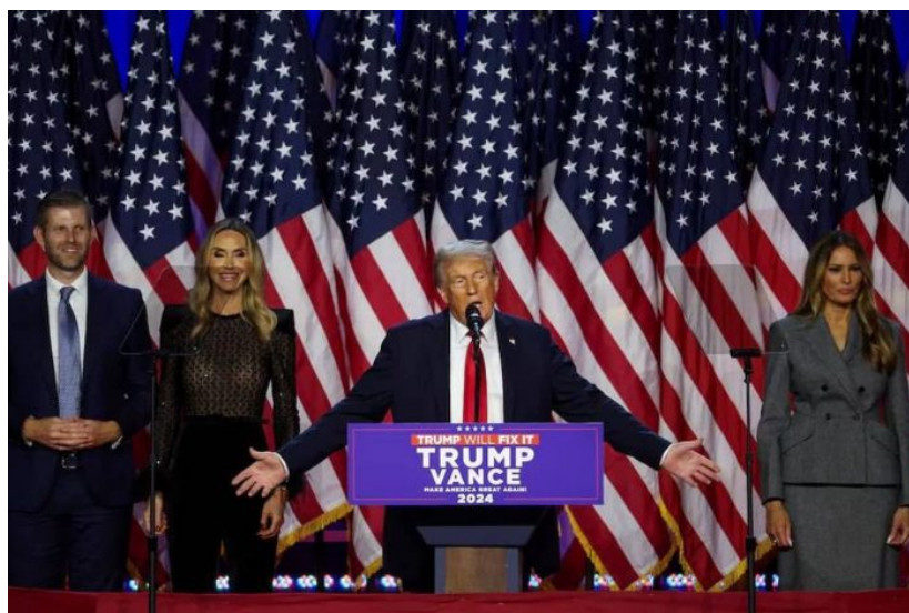
Donald Trump před fanoušky oznamuje své vítězství v amerických volbách

“Říkám to pořád, umírám touhou vrátit se, abych to mohl dělat. Nakonec zrušíme federální ministerstvo školství,” řekl začátkem tohoto měsíce na shromáždění ve Wisconsinu. “Vypustíme vládní vzdělávací bažinu a zastavíme zneužívání peněz vašich daňových poplatníků k indoktrinaci americké mládeže všemi možnými věcmi, které nechcete, aby naše mládež slyšela,” řekl Trump.