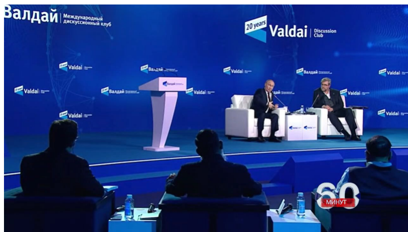
20. Valdajské fórum

Došlo i na otázku Taiwanu, kde se prý odehrává pokus USA o vyvolání nového Majdanu na tomto ostrově, aby se k moci dostali pohrobci Čankajška a figury militantně nenávídící Čínu a fanatičtí zastánci vyhlášené nezávislosti, což by okamžitě vedlo k vojenské intervenci čínské armády. A to by byla záminka USA a kolektivního Západu na uvalení těch samých sankcí na Čínu, které byly uvaleny na Rusko.