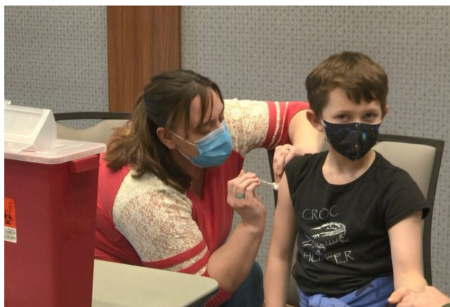
Experimentální roztok nechávali rodiče vstříkovat i do svých dětí

Mnoho lidí si všimlo, že většina lidí, která se nechala očkovat, podporuje válku na Ukrajině. A to i lidé, kteří byli dříve protiválečně nastavení, ale nechali se v době pandemie očkovat. Pamatujete si, jak jsem v roce 2020 psal v člancích pořád dokola řečnickou otázku... proč všechny vlády nejen západního světa tak poslušně, naráz, okamžitě a bez odmlouvání doslova zabily a zavraždily své vlastní ekonomiky a průmysly do lockdownů? Kde se ta ochota vzala? Má to jednoduché vysvětlení – cílem byl vyšší zájem a ovládnutí veškeré populace. Prostě lidem se vpraví narychlo do těl experimentální roztoky, o kterých se jim v médiích navykládají pohádky, že vakcína znamená svobodu. A kdo se nenaočkuje, ten svobodu už nikdy mít nebude.