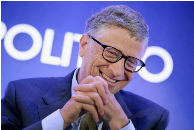
Sponzor globální vakcinace experimentálními roztoky – Bill Gates

Je totiž zjevné, že Total Control proces řízení populace kolektivního Západu byl pouze odložen během války na Ukrajině, a navíc právě teď je ten proces v tichosti vylepšován, a to právě na úrovni WHO a pandemických zákonů, které převedou národní rozhodování o pandemických opatřeních na globální strukturu a ředitele WHO, čímž se přeskočí politické strany, volby v jednotlivých státech, vědecké obce, prostě úplně všichni. Bude stačit, když ředitel WHO vyhlásí opatření, a ty budou platit ve všech signatářských zemích okamžitě a ihned.