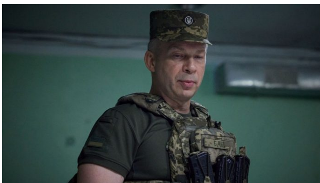
Vrchní velitel AFU Gen. Alexander Syrský

oblasti. Nad skutečnou rolí vrchního velitele AFU Alexandra Syrského jsou neustále otazníky spojené s podezřením, že je vysoce utajeným agentem ruské GUR a pomáhá Rusům na Donbasu tím, že přesunuje vojáky do Kurské oblasti, čímž prodlužuje ukrajinskou frontu a o to více ji oslabuje.