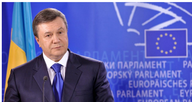
Viktor Janukovyč, poslední legitimní prezident Ukrajiny

Ale Brusel na straně druhé požadoval uzavření hranic před bezcelním prouděním ruského zboží na Ukrajinu. Kyjev měl totiž s Moskvou podepsanou smlouvu o volném obchodu a Kyjev by musel přistoupením k Asociační smlouvě s EU tuto dohodu s Ruskem zrušit. Smlouva s EU navíc požadovala privatizaci státní infrastruktury, především elektráren, rozvodných sítí, plynáren, vodáren a především státního bytového fondu. Janukovyč si uvědomil, že podpisem Asociační smlouvy by Ukrajina víc ztratila než získala, a tak podpis smlouvy odložil s tím, že podmínky smlouvy je potřeba ještě pozměnit.