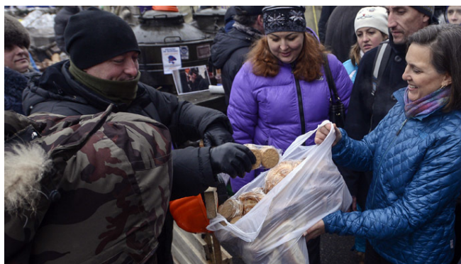
Victoria Nuland rozdává koláčky na Majdanu v Kyjevě

Nakonec 22. února 2014 došlo ke svržení Viktora Janukovyče a moci na Ukrajině se chopily kádry připravené americkým ministerstvem zahraničí. Spolu s převratem začaly pogromy proti Rusům, které vyvrcholily 4. května 2014 v Oděse, kde v Domě odborů došlo k upálení několika desítek Rusů oddíly Právěho sektoru.