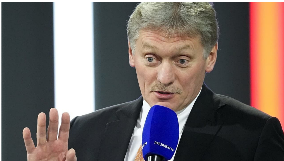
Dmitrij Peskov, tiskový mluvčí Kremlu

Znovu by se ukázalo, že USA prvoplánově zůstávají pozadu a nechtějí se do eskalace osobně zapojovat, ale na druhé straně nijak nebrání evropským zemím v této eskalaci. Prostě by se znovu potvrdilo, že cílem je likvidace Evropy a její zničení podle předobrazu I. a II. sv. války, kdy samotného území USA se ani jedna z těchto válek netýkala. Z obou válek ale USA profitovaly, především z té druhé. Kreml už ve středu uvedl [4], že se domnívá, že Washington již dal Ukrajině souhlas k úderům na cíle uvnitř Ruska pomocí raket dlouhého doletu dodávaných USA, ale učinil tak tajně.