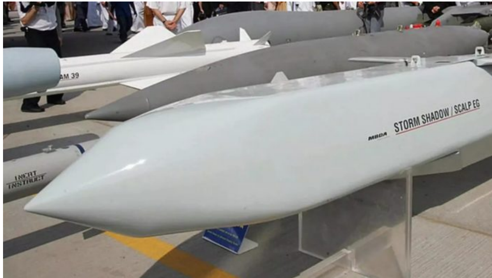
Britská raketa s plochou dráhou letu Storm Shadow

součástky a americké řídicí systémy, bude Londýn potřebovat tichý souhlas Washingtonu. A nedovolit Ukrajině rakety dlouhého doletu, to by v této chvíli bylo považováno za zradu Kyjeva a ústupek Rusům. Dá se proto očekávat, že Londýn povolení vydá na své rakety Storm Shadow, které budou padat na Rusko.