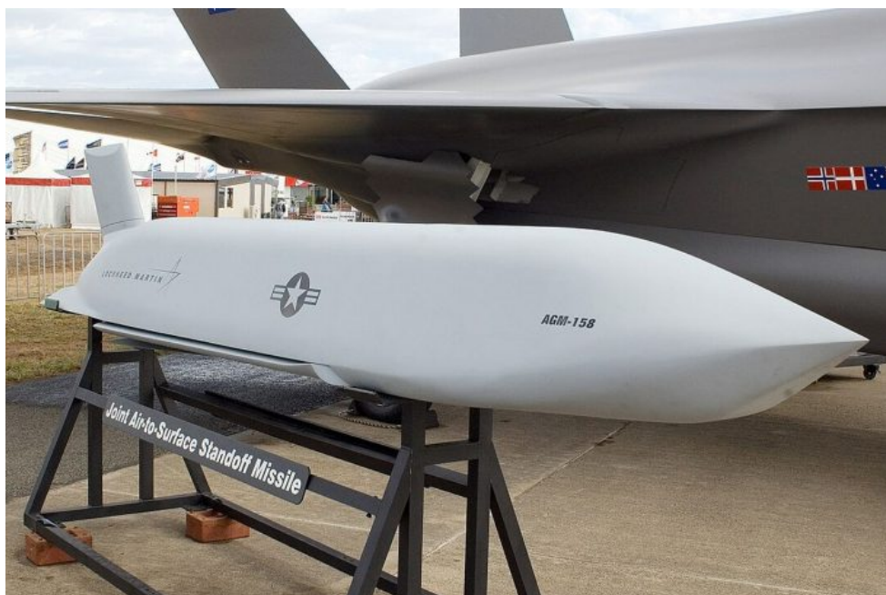
Americká AGM-158 JASSM raketa s plochou dráhou letu

Začátkem tohoto roku daly Spojené státy Ukrajině zelenou k použití zbraní dodávaných Západem proti ruským silám při přímém nasazení za hranicemi. Peskov uvedl, že povolení ukrajinských úderů na ruském území by dále ospravedlnilo vojenské akce Moskvy, která tvrdí, že ruská invaze na počátku roku 2022 byla reakcí na západní podporu Ukrajiny.