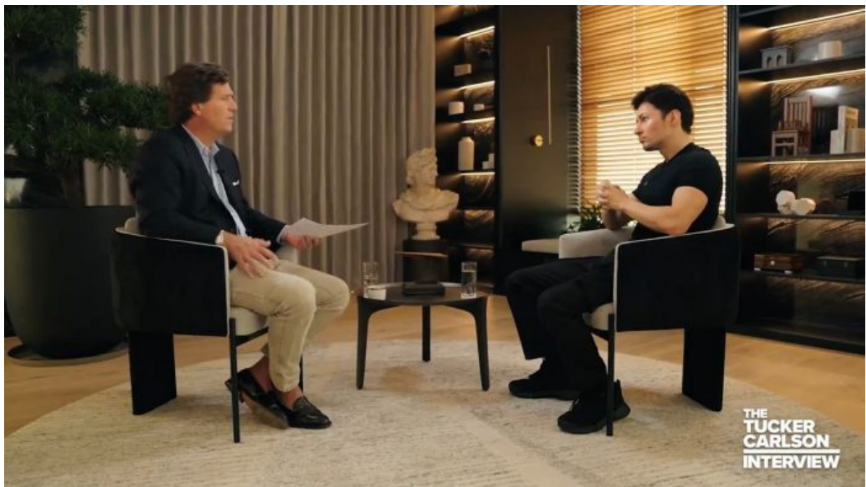
Rozhovor Tuckera Carlsona s Pavlem Durovem v Dubaji v dubnu 2024

Pokud se potvrdí, že za žalobou stojí obvinění ze šíření tajných izraelských dokumentů, které byly vytěženy íránskými hackery, potom opravdu hrozí opakování osudu Juliana Assange. O tom není pochyb! Je to totiž stejný scénář. Nejprve únik vládních a vojenských materiálů, potom jejich uveřejnění na sociální síti a následně odmítnutí vedení sociální sítě o cenzuru a odstranění uniklých materiálů s odkazem na svobodu slova a svobodu novinařiny.