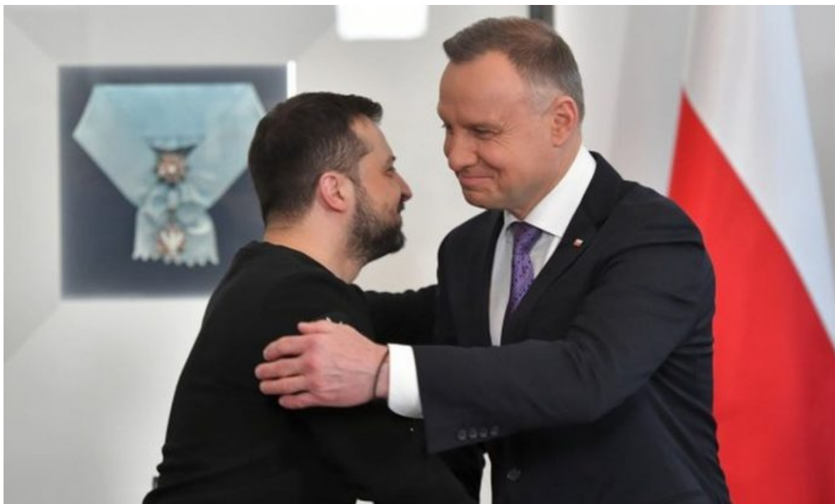
Volodymyr Zelenskyy a Andrzej Duda

A co je naprosto neuvěřitelné, to je načasování. Německo není suverénní země, která by mohla v době války NATO a EU proti Rusku na Ukrajině, a nyní dokonce už i na ruském území, jen tak obviňovat polské a ukrajinské představitele z terorismu a ze sabotáže namířené proti Německu, proti německému průmyslu a proti energetické bezpečnosti Německa, tedy proti tomu Německu, které Ukrajině dodává, resp. dodávalo zbraně a munici. Německá BND dva roky mlčela jako hrob a nikdo nevěří tomu, že jí trvalo dva roky zjistit viníky a pachatele.