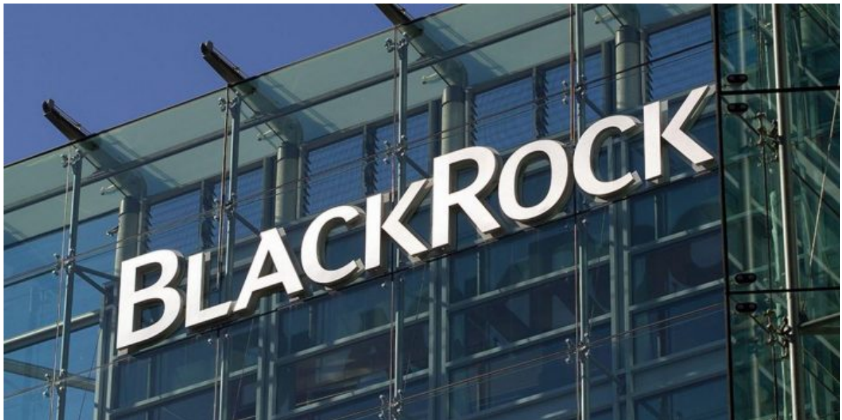
Investiční gigant BlackRock

A jen pár dní po invazi najednou zničehonic Německo najednou veřejně obviňuje Ukrajinu a Polsko ze sabotáže namířené proti německému průmyslu, tedy ze sabotáže proti Nord Stream plynovodům. Zelenský a Duda jsou najednou vykresleni jako vyvrhelové, kteří se v roce 2022 spikli proti Německu. Takže, co to znamená? No přece to, že dva největší podporovatelé války proti Rusku, tedy Ukrajina a Polsko jsou nyní veřejně obviněni, že provedli sabotáž proti Německu a německému průmyslu. A tohle obvinění, kterému můžeme a nemusíme věřit, přichází po dvou letech naprostého mlčen, jen pár dní po invazi Ukrajiny a Polska do Kurské oblasti. Ano, je to úder od BlackRock proti Varšavě a Kyjevu.