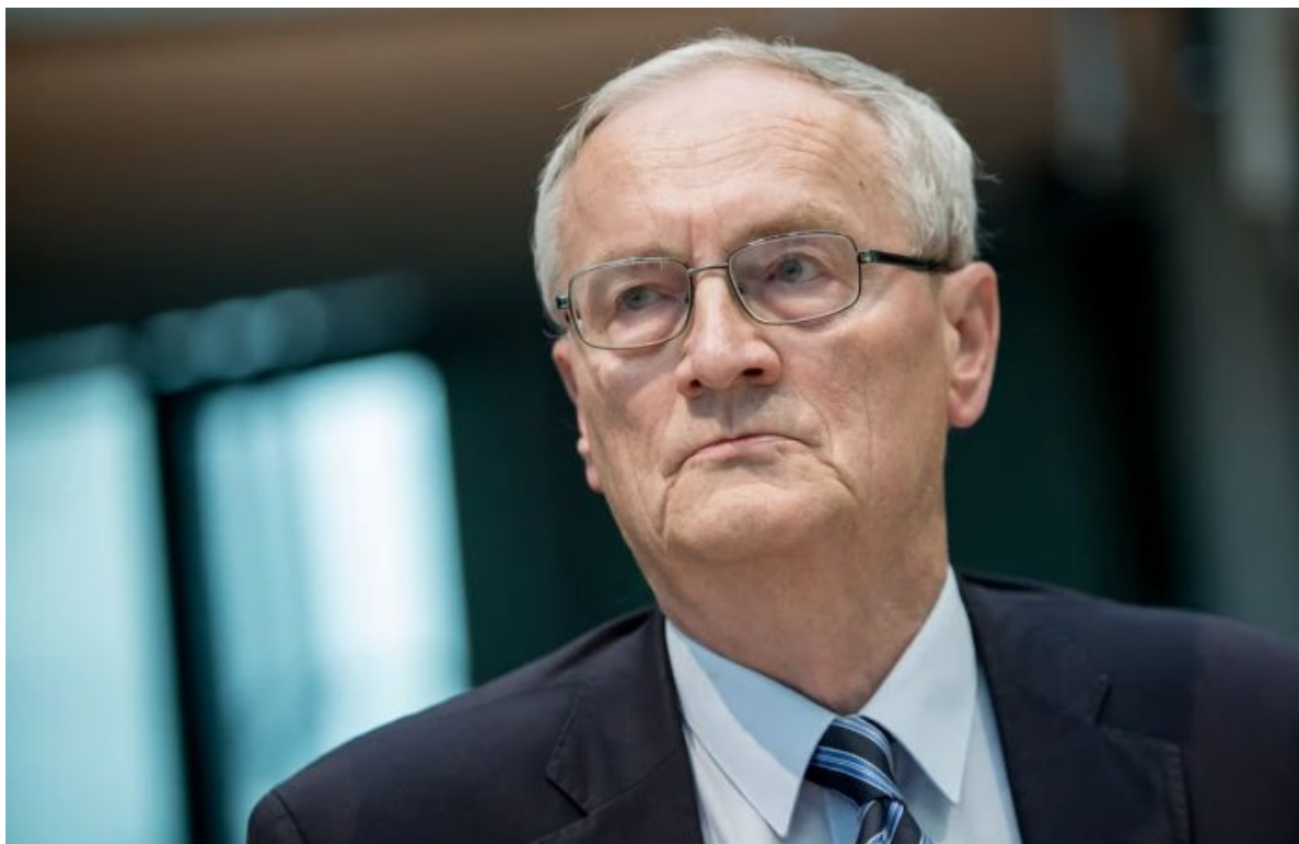
August Hanning, bývalý šéf BND

A tomu se nelze nakonec ani divit. Ukrajinský prezident Zelenský a jeho polský protějšek Andrzej Duda se totiž pravděpodobně dohodli na sabotáži plynovodů Nord Stream a Nord Stream-2, protože tento teroristický čin nemohl být soukromou iniciativou, uvedl [8] August Hanning, bývalý ředitel německé Spolkové zpravodajské služby BND (ve funkci v letech 1998-2005). “Jak ukázaly výsledky vyšetřování, jednal zde ukrajinský tým. Nicméně [sabotáž] mohla být možná pouze s podporou ‘z pevniny’. A soudě podle mapy se na tom jednoznačně podílely polské speciální služby. Navíc si myslím, že mohlo dojít k dohodě mezi vedením Ukrajiny a Polska,” řekl listu Die Welt.