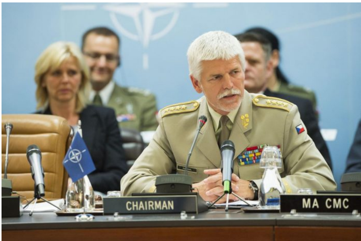
Petr Pavel jako šéf vojenského výboru NATO

K čemu došlo? No přece k tomu, že Kyjev stáhl z Donbasu celkem 3 brigády, čímž otevřel Rusům cestu. To je celé! A proč by to Kyjev dělal? Na to existuje děsivá a jedna jediná opověď – je to součást plánu NATO! Ukrajina Rusku odstoupí Donbas formou nachystané porážky AFU v bojích. Na této linii totiž nemá Ukrajina sílu zvrátit průběh bojů, pouze je dokáže zpomalovat, takže bylo rozhodnuto Donbas “prohrát” a ustoupit z něj v bojích, kdy Rusové nepůjdou zastavit. Očekává se, že po dosažení administrativních hranic Doněcké a Luhanské oblasti se Ruská armáda zastaví. Co se týče Chersonu a Záporoží, tam se zřejmě nic neposune.