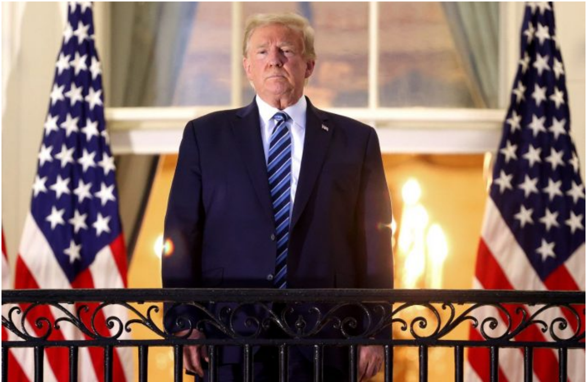
Donald Trump na balkóně Bílého domu

Západní země neuznají ruské hranice těchto regionů jako součást Ruska, ale údajně má NATO a Brusel plán, že donutí Ukrajince zastavit boje a “ztratit” území Donbasu. Za tímto účelem Kyjev stáhl z Donbasu elitní útvary své armády a vrhl je do Kurské oblasti. Jinými slovy, je to součást plánu, jakým Kyjev zdůvodní ztrátu Donbasu jako porážku a nikoliv jako odevzdání území. Je to naprosto jasné!