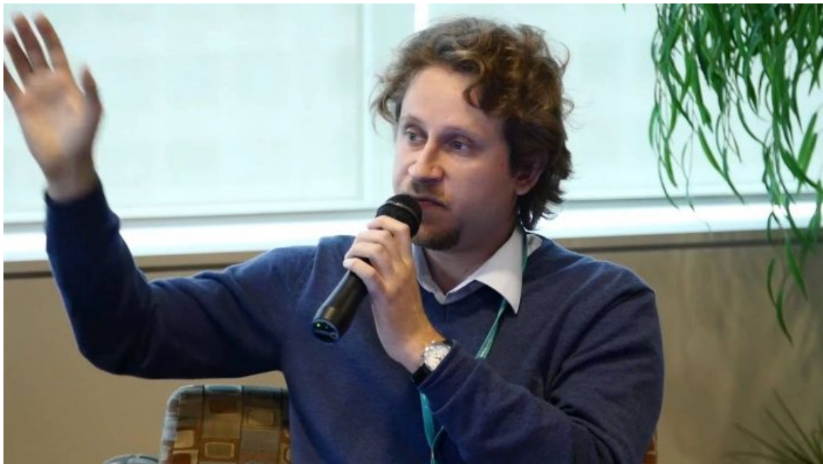
Ukrajinský sociolog Volodymyr Iščenko

přesunutí 3 brigád z Donbasu do Kurské oblasti a tím způsobené drastické oslabení ukrajinských pozic na Donbasu, je součástí “uvědomění” Kyjeva, že Donbas prostě zůstane v rukách Rusů.