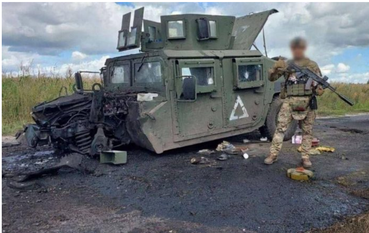
Ruský voják pózuje před zničeným Humvee ukrajinské invazní skupiny v Kurské oblasti

Na třetí možnost, tedy sliby od NATO, že Ukrajinu za člena nepřijmou, se už Kreml spoléhat nemůže, protože slovu Západu nelze věřit. Jinými slovy, v této chvíli je jedinou zábranou vstupu Ukrajiny do NATO prodloužení války, a to se od 6. srpna znovu povedlo. V Kurské oblasti to bude prodloužení se vším všudy a Moskva se postará, aby to bylo na dlouho. Nic si nenamlouvejme, protože důvodem pro spuštění SVO bylo zablokování vstupu Ukrajiny do NATO. A pokud tento cíl nebude spolehlivě a garantovaně zajištěn, do té doby Moskva nebude chtít válku ukončit. Takhle je potřeba se na to dívat.