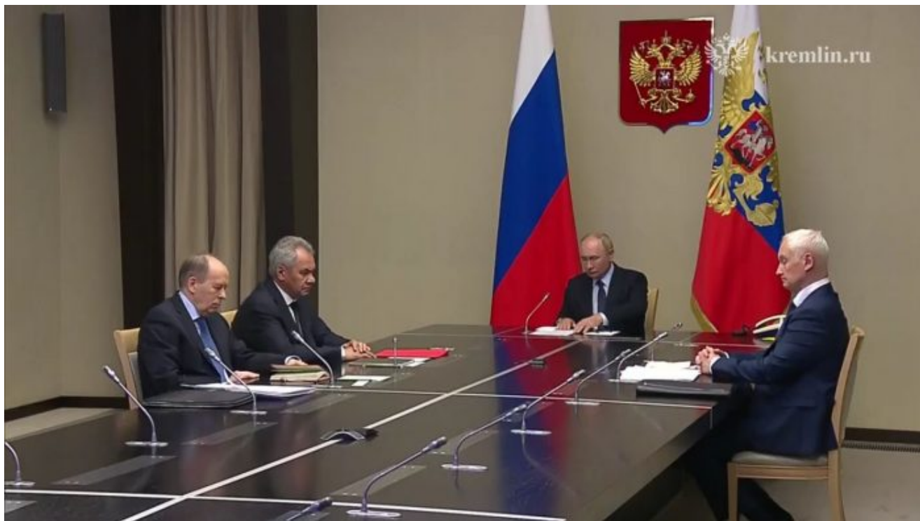
Zasedání Rady bezpečnosti RF. Zleva: Poradce prezidenta Nikolaj Patrušev, tajemník Rady bezpečnosti RF Sergej Šojgu, prezident Vladimir Putin a ministr obrany Andrej Belousov

Válka je totiž živitelka. A pro Ukrajinu toto heslo platí trojnásob. Dokud je válka, Ukrajině platí její provoz USA, Evropská unie a Pařížský klub věřitelů. Všichni chtějí Ukrajinu oholit, ale to se nedá ve válečném stavu. Dokud válka trvá, musí všichni Ukrajinu dál podporovat, aby... aby nepřišly o své investice. Ale pokud Rusko bude dál postupovat, přijdou investoři ze Západu rovněž o své investice. Pro BlackRock je tohle vabank a nebude se mu to líbit. Tohle je velmi nebezpečná karta, která může stát Zelenského jeho život. Může vést válku proti Rusům a nic se mu nestane. Ale pokud začne hrát válku proti BlackRocku a nosatému Pařížskému klubu, nemusí to mít pro Zelenského dobrý konec.