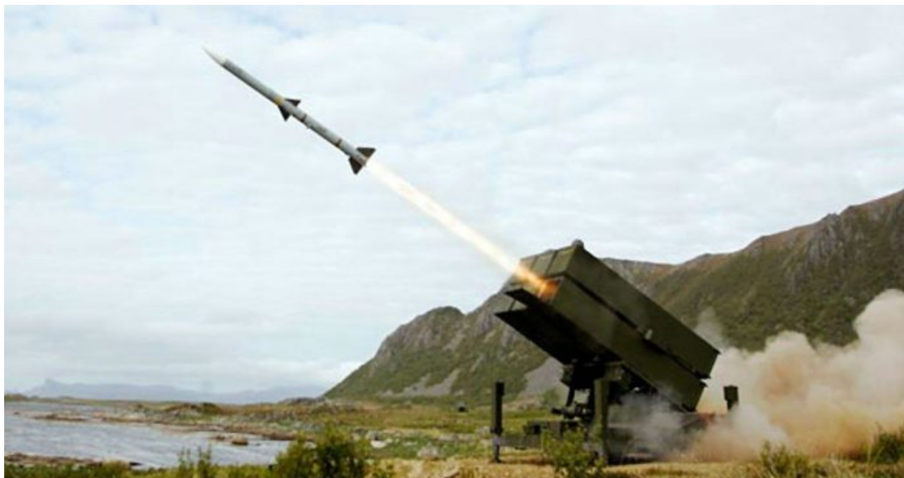
AIM-120 raketa vypálená z komplexu NASAMS

Ruská armáda použila v pondělí Kinžály na jiné objekty v Kyjevě, než zachycují videa. Kinžály se používají proti bunkrům a opevněným cílům. Proti běžným budovám se používají střely Kalibr a rovněž křídlaté střely s proudovým a velice hlučným motorem Kh-101, které natočil svědek v druhém videu. Na rozdíl od Kinžálu jsou tyto typy raket subsonické, ale přesto je ukrajinská PVO nedokázala v pondělí zachytit.