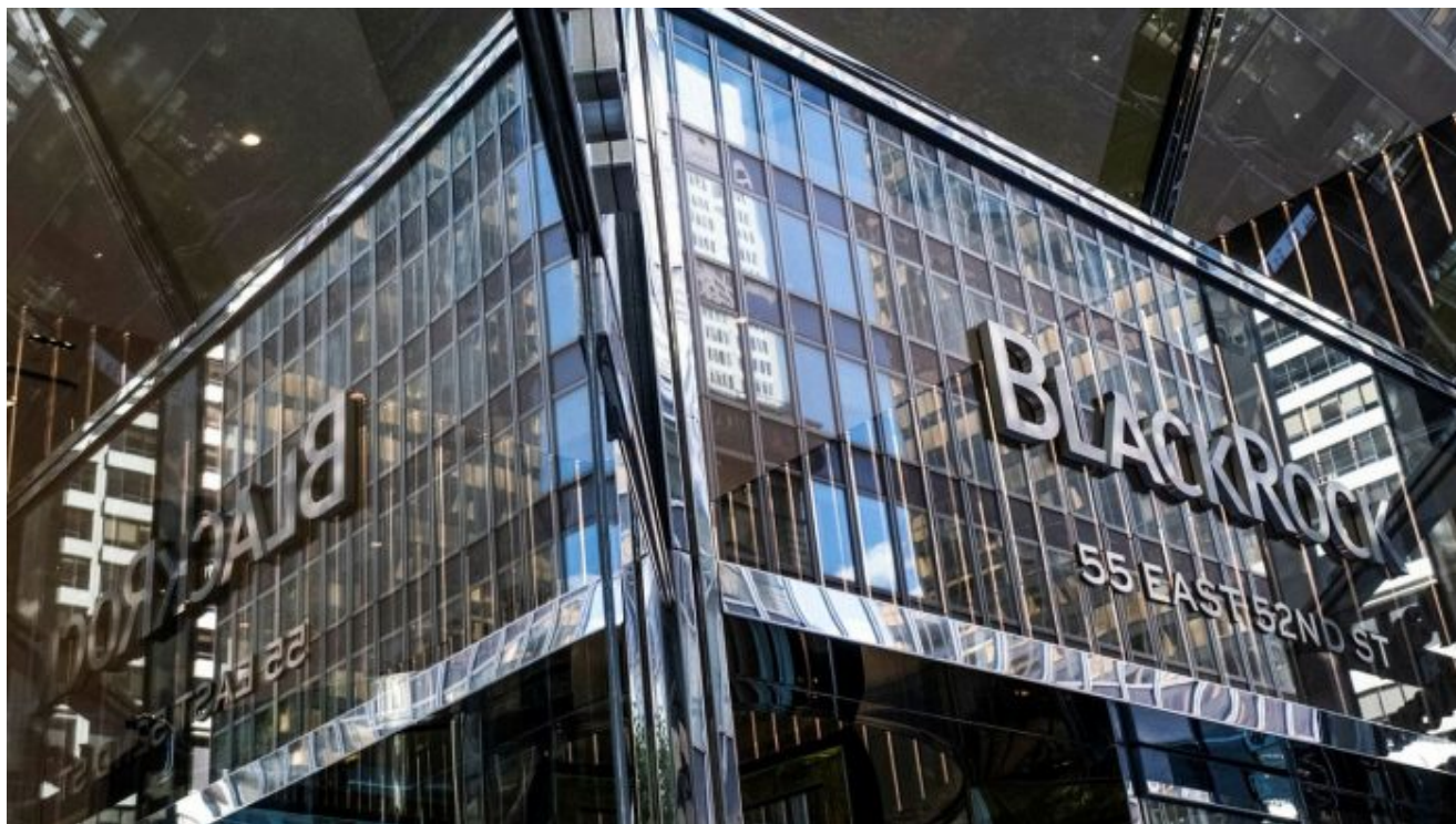
Centrála BlackRock v New Yorku

BlackRock Inc., Fidelity International, Amia Capital a Gemsstock Ltd patří k největším držitelům ukrajinského dluhu, jehož tržní hodnota se propadla o více než 80 % od doby, kdy koncem roku 2021 začalo na hranicích země hromadění ruských vojsk, uvedl [5] roce 2022 Reuters. A právě v roce 2022 nakonec tito věřitelé dali Ukrajině odklad splátek dluhů na 2 roky do konce července 2024. Takže ne Ruská armáda, ne ruské rakety, ani ruská ofenzíva v Charkově, ale tlak nosatých věřitelů v Kyjevě dotlačí Zelenského k mírovému stolu. Taková je realita!