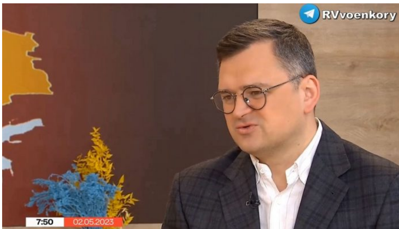
Dymtro Kuleba, ministr zahraničí Ukrajiny

Tento článek je přesně tím důvodem, proč došlo k tak náhlé změně narativu kyjevské propagandy o válce na Ukrajině. Ještě před pár měsíci ministr zahraničí Dmytro Kuleba tvrdil, že Ukrajina bude bojovat až do vítězství a klidně i sama, i bez západní vojenské podpory, a to tak dlouho, dokud nevytlačí Rusy z Ukrajiny. A teď se dozvídáme z německého listu, že v tichosti už dva týdny probíhají jednání Kyjeva a západních věřitelů o restrukturalizaci státního dluhu Ukrajiny a dohoda je v nedohlednu.