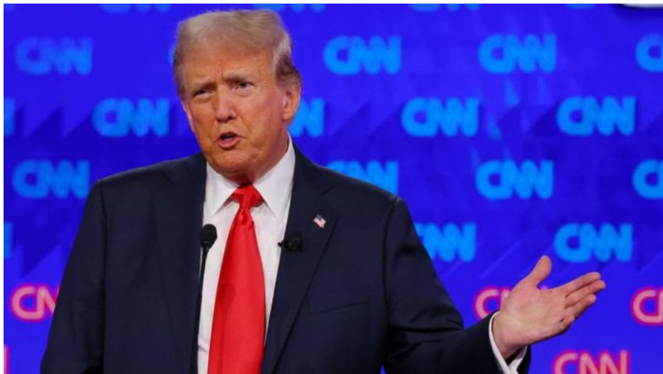
Trump v debatě působil vyrovnaně

Ovšem v rámci globalistického odpisu USA není nic vyloučeno. Jinými slovy, poslední 4 roky měli Američané za prezidenta dementního staříka, a teď brzy možná budou mít 4 roky za prezidenta kriminálního úřadujícího z luxusně vybavené cely. Pokud globalisté chtějí rozbít USA a škodit moci Pax Americana a její pověsti, potom udělají s Trumpem přesně tohle, případně něco velmi podobného. Bude cirkus? To se uvidí.