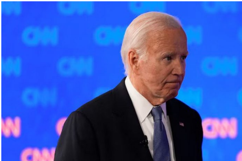
Biden přišel na debatu opožděně, to nebyl dobrý signál

Prostě odstoupit ze zdravotních důvodů z kampaně by vedlo k ještě většímu tlaku, aby ihned odstoupil z pozice prezidenta. Jinými slovy, v této chvíli je hotovo a vymalováno. Donald Trump se vrací do Bílého domu. Jediné dvě věci ho mohou zastavit: Atentát, anebo zavření do kriminálu.