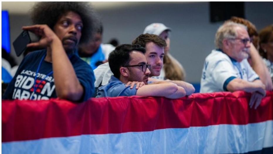
Příznivci amerického prezidenta Joea Bidena se scházejí v hotelu Hyatt Regancy v centru Atlanty na večírku při sledování první prezidentské debaty ve čtvrtek 27. června 2024