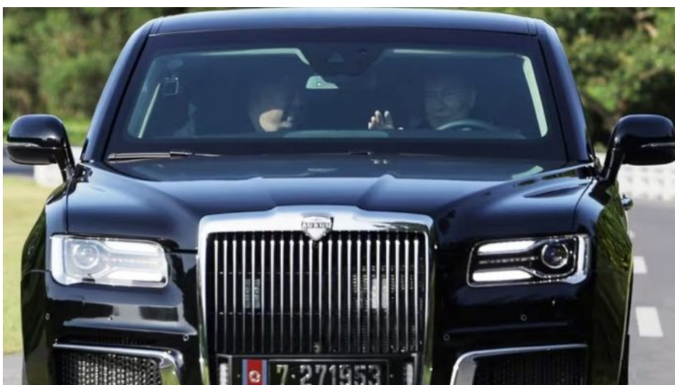
Vladimir Putin svezl Kim Čong Una v ruské limuzíně Aurus

Britský list The Guardian [3] má de facto stejné obavy ohledně vojenského paktu Rusko – KLDR. Začlenění doložky o vzájemné obraně do jejich komplexního strategického partnerství, které Kim označil za “ spojenectví ”, přispěje k znepokojení Západu nad rostoucími ekonomickými a vojenskými vazbami mezi Severní Koreou a Ruskem. Dohoda byla podle informací dokončena ve středu po několikahodinových jednáních v severokorejském hlavním městě Pchjongjangu.