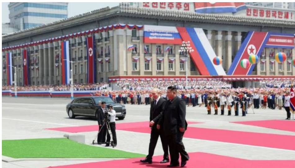
Velkolepé uvítání v Pchjongjangu

Počty se pouze odhadují a odvozují od dezertérů, kteří utekli z KLDR. Co je však spočítáno a odhadnuto velice přesně, to je počet dělostřeleckých granátů, které Kim dodal Ruské armádě, a mělo by jít až o 5 milionů dělostřeleckých granátů [1], které od počátku tohoto roku v nákladních kontejnerech a po železnici dodala severokorejská strana do Moskvy.