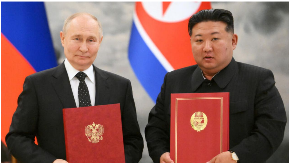
Podpis smlouvy o vzájemné obraně

Kimova KLDR tak má od této chvíle na Korejském poloostrově za sebou Rusko jako vojenského spojence, který přijde KLDR na pomoc, pokud by USA nebo proxy Jižní Korea zaútočily na KLDR. Rusko zatím podobnou smlouvu má podepsanou pouze s několika post-sovětskými zeměmi v rámci tzv. Organizace smlouvy o kolektivní bezpečnosti (CSTO) spojujících do kolektivní obrany Rusko, Bělorusko, Arménii, Kazachstán, Kyrgyzstán a Tádžikistán. Rusko zatím žádnou vojenskou alianci se zemí mimo bývalý blok zemí SSSR nepodepsalo. Toto je poprvé, kdy Rusko podepsalo alianční pakt s nesovětskou zemí, a jedná se rovnou o zemi, která disponuje jadernými zbraněmi, podle mezinárodních odhadů asi 50 hlavicemi.