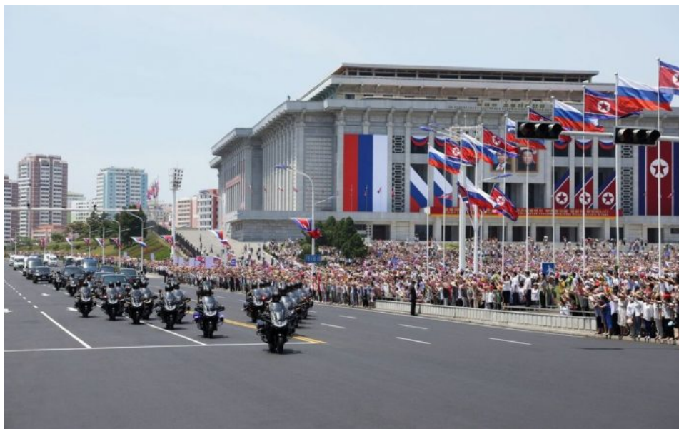
Uvítání Vladimira Putina v Pchjongjangu bylo naprosto nevídané

bezpečnostní dohody nezveřejnily. Nebylo bezprostředně jasné, jakou formu by tato podpora mohla mít, a zveřejněno bylo jen několik málo podrobností dohody.