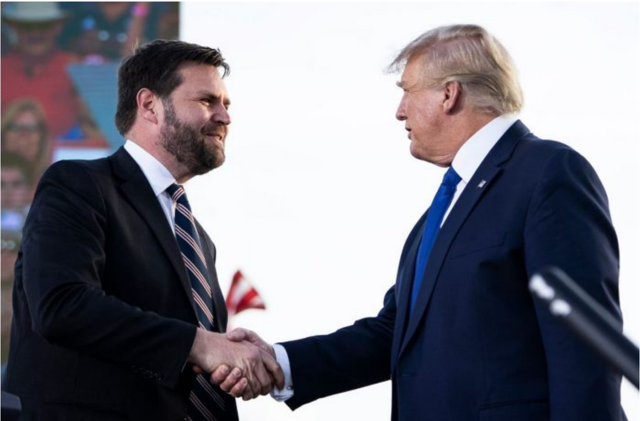
Senátor za Ohio J. D. Vance a Donald Trump

civilní objekty, zabíjí ruské obyvatelstvo. Kreml může ustupovat do určité míry v zájmu zabránit III. sv. válce, ale nemůže ustupovat donekonečna.