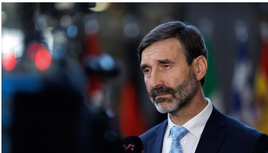
Juraj Blanár, ministr zahraničí Slovenska

orgány země, zdůraznil prezident. Snaha o udržení Zelenského u moci je zřejmě součástí plánu na eskalaci války na Ukrajině a většího zapojení NATO do bojů. Jedna nebezpečná věc totiž zcela unikla pozornosti.