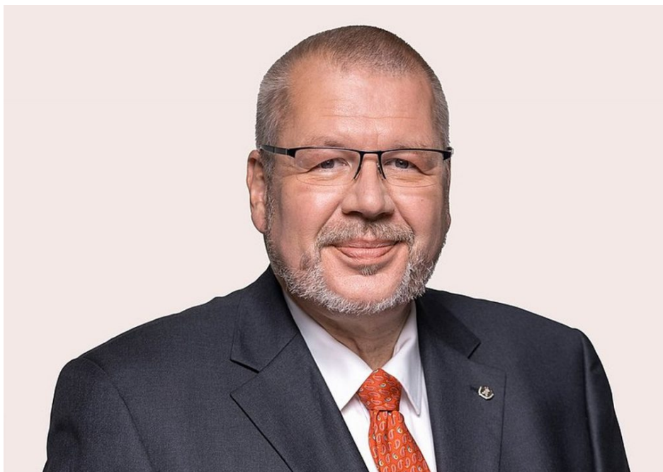
Německý poslanec Joe Weingarten (SPD)

Jakmile je Fico odstavený od výkonu funkce, jestřábi v Evropě skrze nastrčené poslance Scholzovy SPD hned zkouší odolnost slovenské vlády, jestli postřelením premiéra trochu nevyměkla a nepřišla náhodou k rozumu a k poslušnosti. Reakce Juraje Blanára potvrdila, že nic takového nenastalo a doufejme nenastane, ale je to důkaz toho, že atentát na Fica je až okatě a příliš na hulváta ihned využíváný k různým kovbojským testovacím pokusům na ovlivnění Ficovy otrěsené vlády.