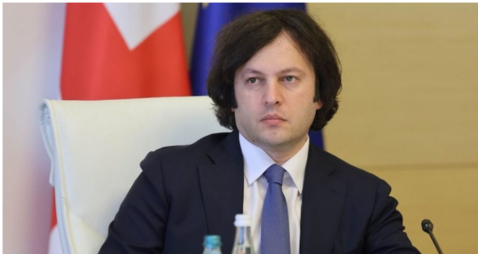
Irakli Kobachidze, gruzínský premiér

Kobachidze prohlásil, že komisař pronesl tuto poznámku, a dodal: “Viděli jste, co se stalo (slovenskému premiérovi) Ficovi, a měli byste být velmi opatrní.” Tím narážel na to, že minulý týden byl vládní činitel postřelen ve středoslovenském městě Handlová. “Veřejnost sleduje vývoj kolem zákona o transparentnosti a všimla si, že několik vysoce postavených zahraničních politiků neváhá používat otevřené vydírání proti gruzínskému lidu a zvolené vládě,” tvrdí premiér. “Na tento druh urážlivého vydírání jsme si už zvykli a v podstatě přestalo působit na společnost i vládu,” dodal.