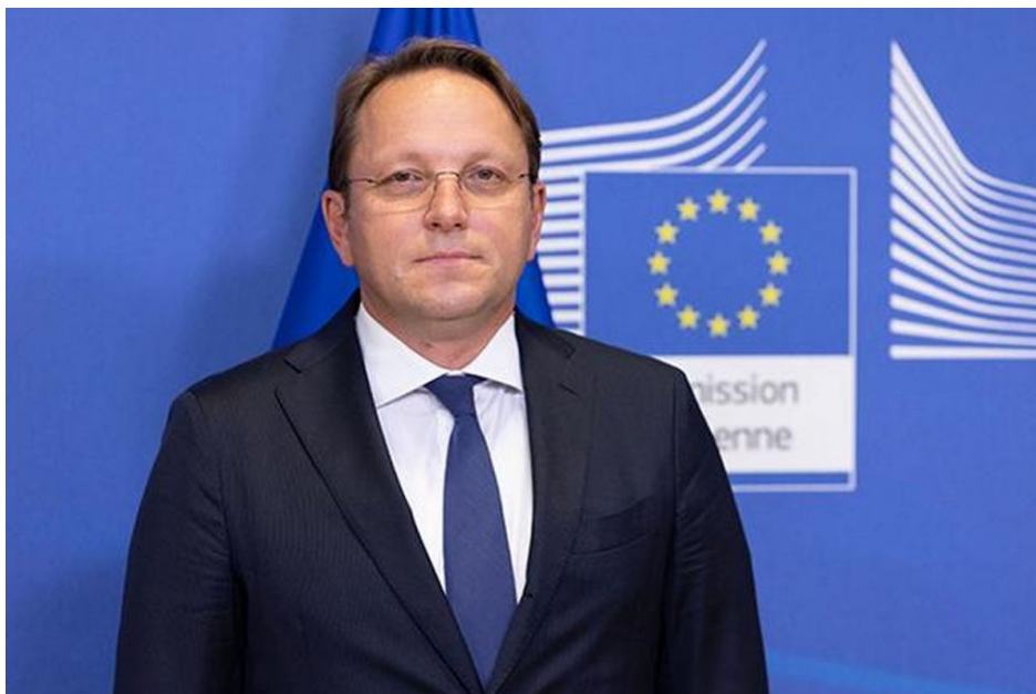
Komisař pro sousedství a rozšíření Olivér Várhelyi

Nakonec se i ukázalo, kdo byl oním nejmenovaným eurokomisařem. V prohlášení, které bylo zveřejněno ve čtvrtek večer, komisař pro sousedství a rozšíření Olivér Várhelyi uvedl [4], že jeho slova byla “nejen zcela vytržena z kontextu, ale také prezentována veřejnosti způsobem, který mohl vést k naprosto mylné interpretaci původně zamýšleného cíle mého telefonátu” . Ovšem toto vysvětlení gruzínský premiér odmítl s tím, že slova byla pronesena v audio záznamu hovoru tak, jak je citoval, a tudíž nešlo o desinterpretaci nebo chybu v překladu. Jinými slovy, dámy a pánové, tohle už není legrace.