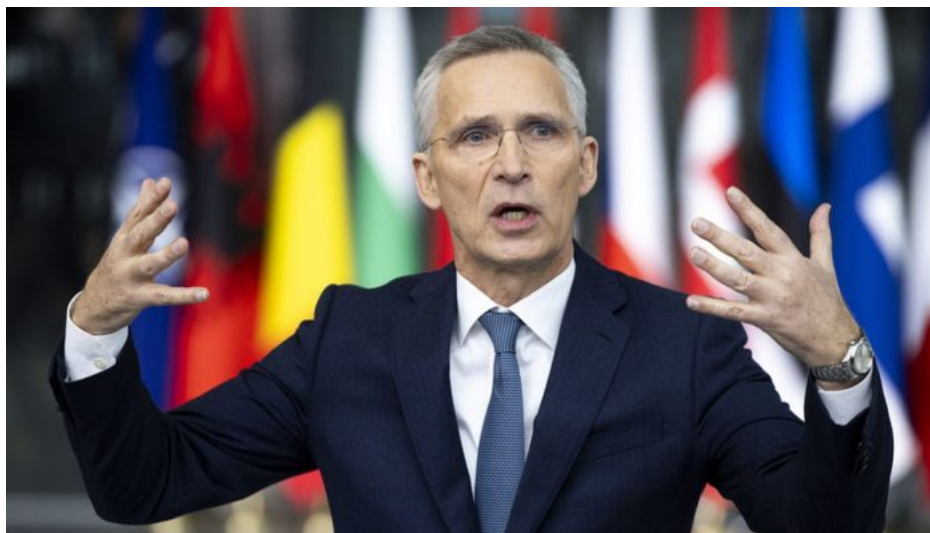
Jens Stoltenberg, generální tajemník NATO

Myslíte, že ti generálové nevědí, že dojde k ruské odvetě? Ale ano, vědí. Jenže podle všeho to vypadá, že si myslí, že válka s Ruskem se dá vyhrát, že kolektivní Západ může přímou konfrontaci vyhrát , a že se prostě vyplatí v této chvíli využít zdrženlivost Ruska a udeřit tak proti Rusku přímo raketami NATO a postupně vyřadit jeho strategickou obranu, přičemž se to bude maskovat tím, že ty rakety budou fyzicky z Ukrajiny odpalovat Ukrajinci.