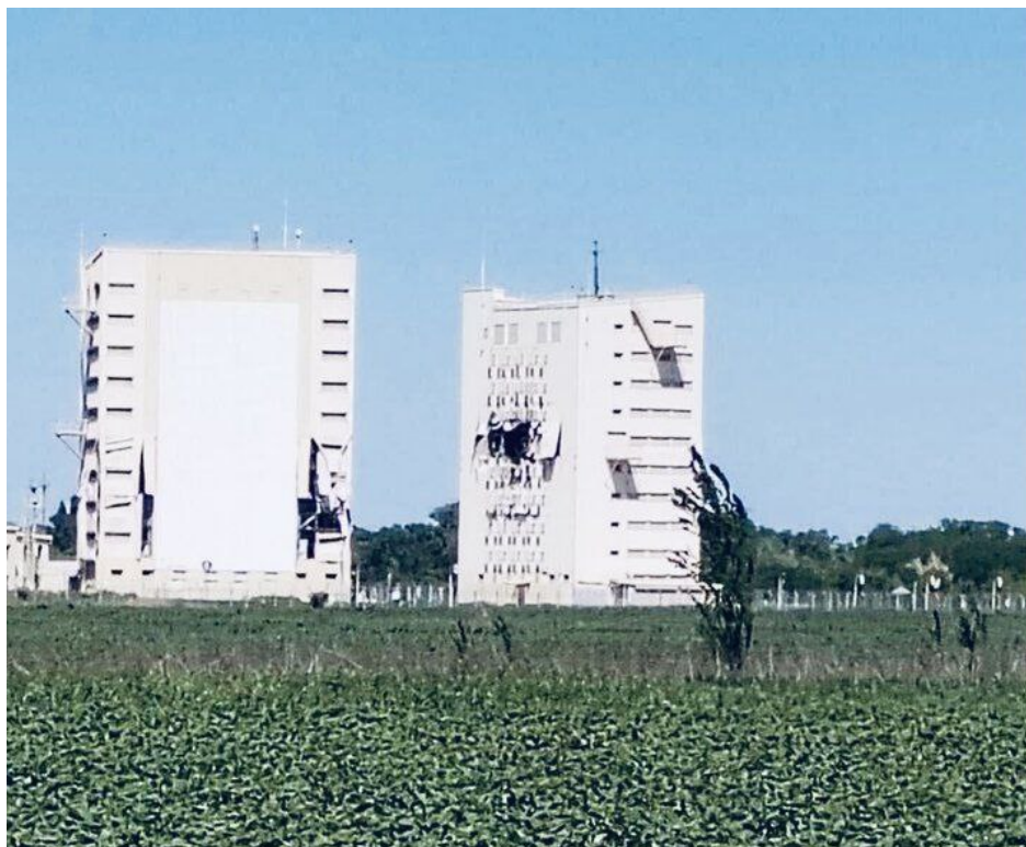
Poškozený zahorizontální radar včasného varování ruské strategické obrany Voronež-DM v Armaviru v Krasnodarské oblasti je prvním varováním, že NATO chystá otevřený vstup do války s Ruskem

A jen pár dní po tomto útoku se najednou schází špičky NATO a jednájí o tom, že začnou střílet západní rakety na Rusko a bude se to maskovat tím, že ty rakety jako budou odpalovat Ukrajinci z Ukrajiny. Ovšem skutečnost, že ty rakety jsou po dobu letu řízeny a programovány infrastrukturou a satelity NATO, je prostě daná a znamená to vstup NATO do války s Ruskem. A na tiskovce to Vladimir Putin jasně vysvětlil, že Ukrajinci ty rakety neprogramují a nenavádějí, že je prostě jenom odpalují ze svého území, ale o navigaci a plánování se starají satelity a systémy velení NATO. Až dosud to probíhalo utajeně a v omezených počtech.