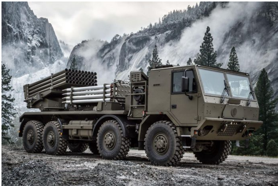
Český raketomet RM-70 Vampire

Ruské vedení důsledně varuje Kyjev a jeho západní podporovatele před útoky hluboko na jeho území a prezident Vladimir Putin navrhl vytvořit na Ukrajině podél hranic "bezpečnostní zónu", která by takovým úderům zabránila. Moskva neuviedla žádný časový rámec, kdy by taková zóna mohla být vytvořena, ani jak hluboko do území Ukrajiny by zasahovala. Americký Pentagon ale v pátek uvedl, že podle zdrojů amerických tajných služeb je otevření nové fronty pokusem Kremlu zasadit Kyjevu definitivní ránu , protože už tak prořídlé řady ukrajinských vojáků na obrovsky dlouhé frontě nyní prořídnu ještě více, protože Ukrajina bude muset oslabit své pozice jinde a přesunout je do Charkovské oblasti.