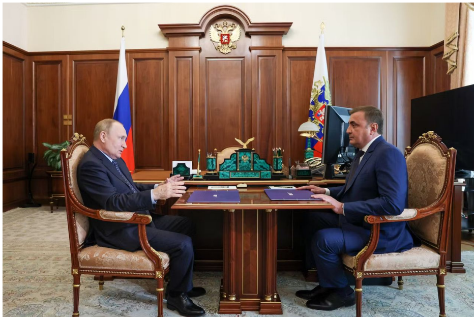
Vladimir Putin s gubernátorem Tulske oblasti Alexejem Djuminem

Vojenské operace v Rusku samozřejmě neřídí ministři obrany přímo, ti mají víceméně civilní zaměstnání a statutární roli resortu obrany, protože řízením operací na bojišti se zabývá generální štáb. Takže ke spuštění ofenzivy a nové fronty není zapotřebí ministr. K čemu ovšem je zapotřebí ministr, to je komunikace armády směrem navenek s veřejností.