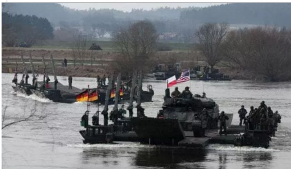
Článek o plánu NATO na intervenci na Ukrajině

di Tommaso Ciriaco e dai nostri corrispondenti Anais Ginori (Parigi) e Claudio Tito (Bruxelles)