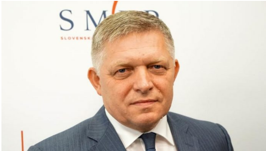
Robert Fico, premiér slovenské vlády

Emoce jsou zkrátka vybičované na maximum a čím déle bude zdravotní stav Roberta Fica nejasný a neurčitý, tím více tyto emoce porostou ve slovenské společnosti. V tom vidím opravdu značné riziko.