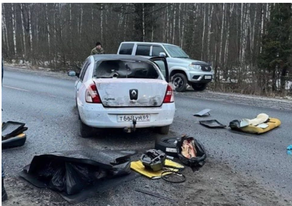
Renault, ve kterém prchali teroristé z Moskvy

Chudí Tádžikové byli naprostí diletanti, kteří navíc dostali tak málo peněz od Ukrajiny, že to stačilo jen na zakoupení jednoho únikového vozu, ojetého Renaultu, se kterým navíc teroristé prchali jako blázni takovou rychlostí, že rychlostní bonzovací kamery okamžitě dopravníkům hlásily, že po dálnici na jihozápad k ukrajinským hranicím se řítí nějaký magor v bílém Renaultu rychlosti skoro 160 km/h.