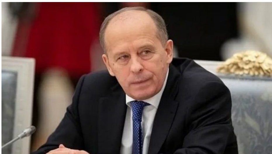
Alexander Bortnikov, ředitel FSB

Bortnikov také uvedl, že ozbrojenci chtěli uprchnout na území sousední země, kde byli očekáváni a měli být přivítáni "jako hrdinové". Je naprosto zřejmé, že džihádisté připravení zemřít mučednickou smrtí v cestě za slávou Alláha v boji proti bezvěrcům by neprováděli útok na splátky záloh, tedy 250 000 rublů předem a zbytek po akci.