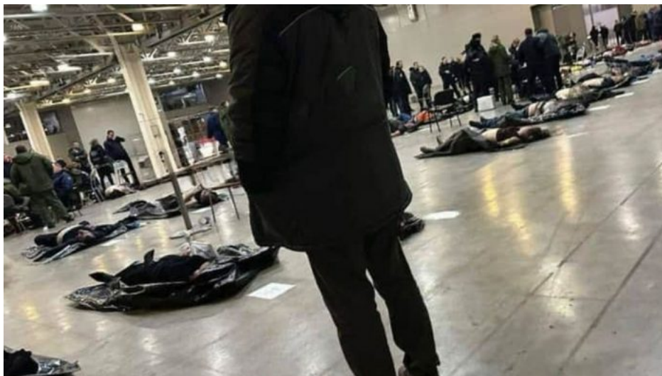
Oběti teroristického útoku v pytlích na mrtvoly na podlaze v hale Crocus centra

Podle ruských médií a zdrojů blízkých Kremlu je šéf ukrajinské vojenské rozvědky GUR Kyrylo Budanov č. 1 na tzv. hit listu ruských tajných služeb a je určen k likvidaci. Byl to on, kdo prý zorganizoval a naplánoval provedení útoku na Crocus City Hall a je tak jasné, že Budanov je v této chvíli už chodící mrtvola. Co však stále není jasné, to je objednavatel tohoto teroru. Podle všeho se zdá, že ukrajinská GUR a SBU akci pouze naplánovaly a zorganizovaly, ale zadání a objednávka přišla odjinud.