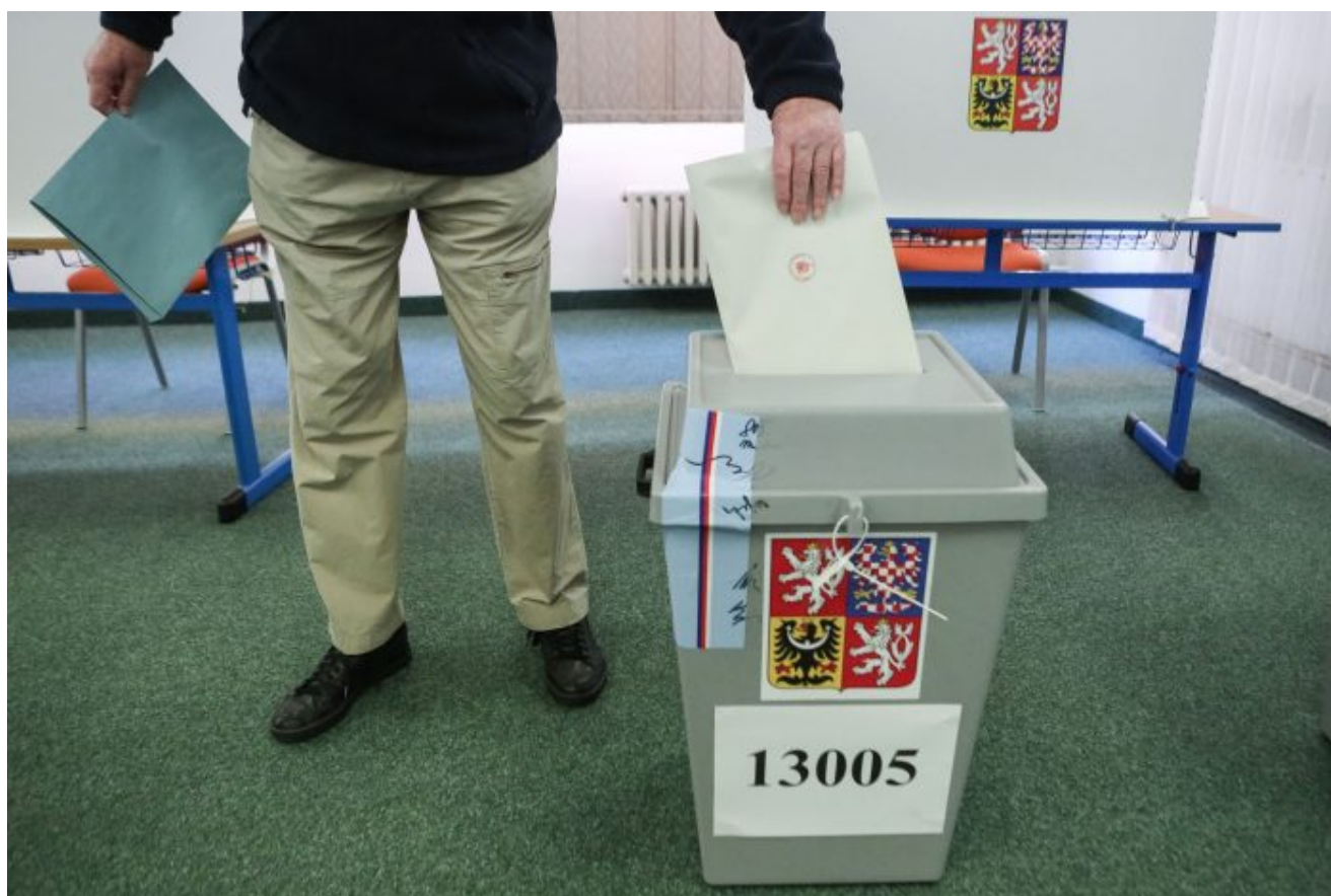
Volič vhazuje obálku se svým hlasem do volební urny

Princip tajnosti voleb totiž nemůže a nesmí být založen na důvěře, ale pouze na principu nezpochybnitelné anonymity. Na důvěře totiž tajnost voleb v českém právním řádu není založena , upozornil nás do redakce právník. Volby jsou založeny na tzv. zaručené anonymitě hlasovacích lístků a potažmo obálek, ve kterých jsou lístky do urny vloženy.