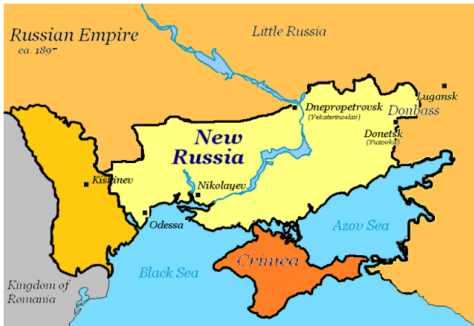
Historické území Novoruska

Jak již informovala agentura Unian, 25. prosince předložil kabinet ministrů Ukrajiny Nejvyšší radě návrh [2] zákona o zlepšení mobilizace a vojenské registrace, který obsahuje přísná omezení pro ty, kteří se vyhýbají odvodu. Mezi taková omezení patří zákaz cestování do zahraničí, blokování všech transakcí s movitým a nemovitým majetkem, zákaz získání řidičského průkazu a řízení vlastního automobilu, omezení práva nakládat s vlastními prostředky a jinými cennostmi. Ukrajinci teď všechno přepisují na manželky a přítelkyně.