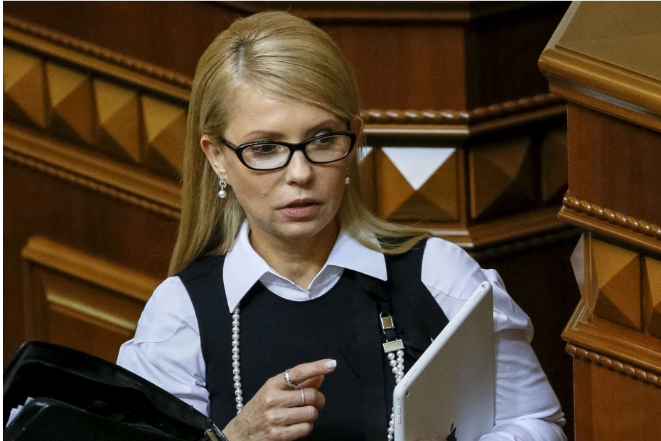
Julia Tymošenko, bývalá premiérka Ukrajiny

Zatímco krátce po ruské invazi byla ukrajinská morálka poměrně vysoko, po necelých dvou letech a po zpackané jarně-letní ofenzívě je všechno jinak. Ukrajinci už nechtějí bojovat, protože ti, kteří chtěli, ti už dávno odpočívají v mohylách a v hromadných hrobech. V této chvíli už Ukrajina vede válku, kterou nikdo z Ukrajinců dobrovolně vést nechce a nechce za Ukrajinu umírat.