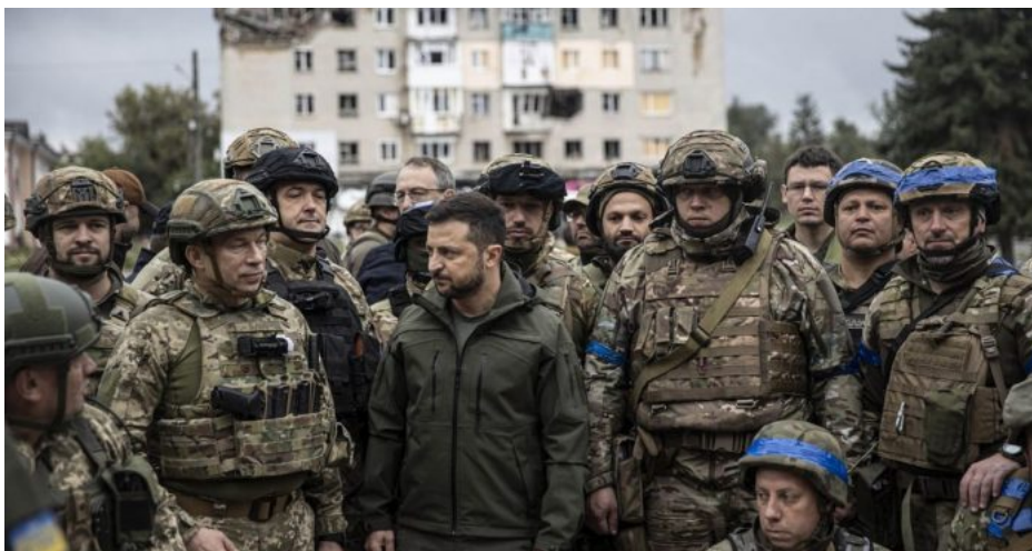
Éra Volodymyra Zelenského se blíží ke konci a jeho sláva na Ukrajině se transformuje do nenávisti lidu proti jeho osobě

V určitém okamžiku ten hrnec exploduje a američtí kurátoři přistaví Zelenskému soukromý tryskáč pro evakuaci. Otázkou je, jestli to udělají rychle, protože půjde doslova o minuty. A nebude to kvůli tomu, že by ho milovali, ale Zelenský by mohl mluvit o amerických biologických laboratořích na Ukrajině, mohl by mluvit o tom, jak americké farmaceutické firmy zkoumaly etnický a rasově specifický virus slovanského genomu DNA a jejich mutace v ukrajinských laboratořích s cílem vyrobit biologickou zbraň proti Rusům.