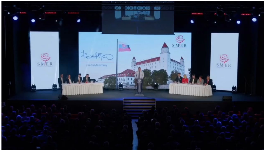
Slavnostní sněm SMERu na Bratislavském hradě 17. listopadu 2023

Vystoupení Roberta Fica sklidilo velký potlesk, ale tímto vystoupením si slovenský premiér udělal velké nepřátele mezi globalistickými farmaceutickými kolosy. Toto ostré odmítnutí smlouvy s WHO tak potvrzuje, že Robert Fico prohlubuje důraz na vlastenecké a národní teze, což lze slovenským voličům opravdu závidět.