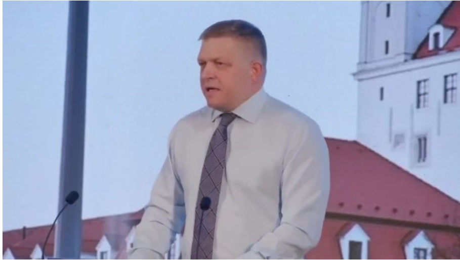
Robert Fico, předseda SMERu během projevu na sněmu na Bratislavském hradě

Americká CNN v neděli vůbec poprvé uveřejnila článek [2], že Ukrajina potřebuje více vojáků, ale ne každý je připraven k odvodu. Ukrajina se potýká s problémem lidských zdrojů. Válka se blíží ke konci svého druhého roku a ukrajinská armáda potřebuje více lidí, aby mohla vést krvavou opotřebovací válku proti Rusku, zemi s více než třikrát větším počtem obyvatel než Ukrajina.