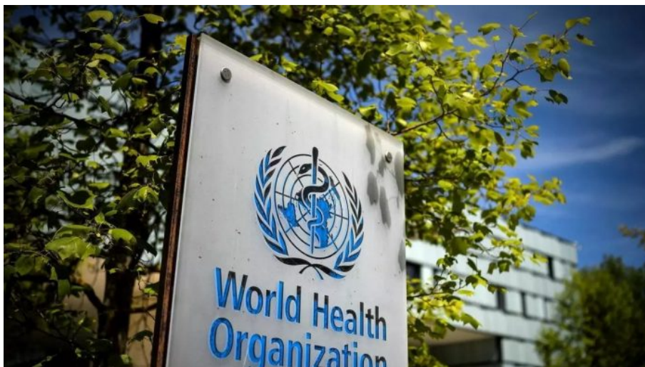
Světová zdravotnická organizace získá po podpisu Pandemické smlouvy kontrolu nad signatářskými zeměmi v případě, že bude vyhlášena pandemie

Organizace je v základu populistický (rozuměj lidový) proces řízení, který je přesným opakem globalistického (rozuměj nadnárodního) procesu řízení a politik, který nastoupí cestu organizace , se vydává na cestu, ze které již není návratu, protože tento proces pálí za sebou mosty a konstrukce vybudované globálními procesy řízení , mezi které patří nejen světová (sionistická) globalizace, ale i systém americké globální moci Pax Americana .