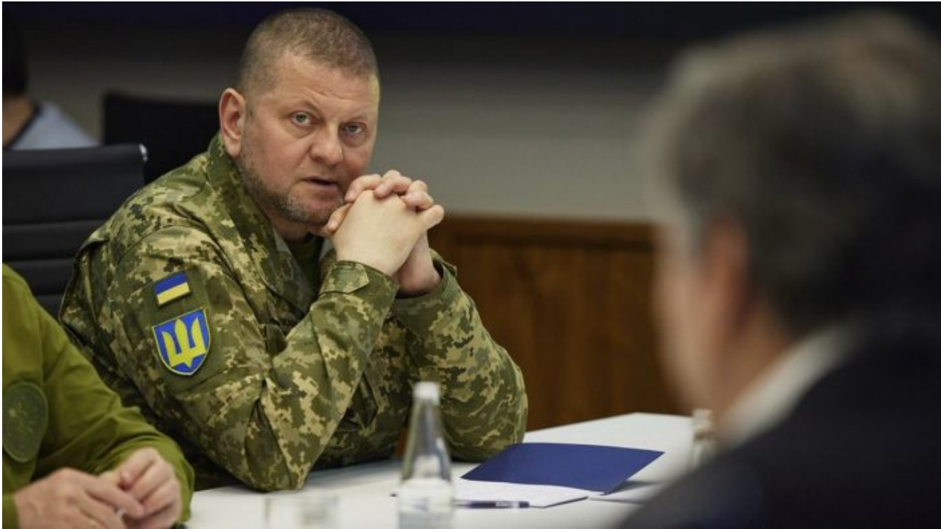
Valerij Zalužný, vrchní velitel ozbrojených sil Ukrajiny

dokáže udržet vojenskou sílu na bojišti v provozu nejdéle. A tady podle obou zdrojů americké NBC již tahá Ukrajina za kratší konec provazu. Rusko nejen, že nemá problém s municí, zbraněmi a s vojenským personálem, ale dokonce ruské HDP za rok 2023 roste [3] skoro o 3% a válčuje Evropskou unii, která letos poroste jen o 0.8%.