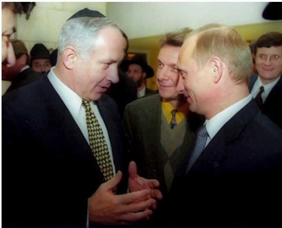
Benjamin Netanyahu a Vladimir Putin

Čečenský vůdce Ramzan Kadyrov na Putinův výrok zatím nereagoval, protože se očekávalo, že Putin vyzve k zastavení bojů na obou stranách a k mírovým jednáním. Místo toho ale prohlásil, že Izrael má právo na obranu, čímž de facto podepsal Izraeli bílým šekem k zahájení pozemní operace IDF v Gaze. Ruským vlastencům opět Putin už poněkolkrátě shodil hodiny ze zdi. Pokud jde o Izrael, Putin je vždy na straně sionistického Tel Avivu.