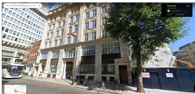
Sídlo Campaign for Freedom v Londýně

Tato videa se slovenským narativem a se záběry ze srpna 1968 a z demonstrací proti Ficově vládě z roku 2018, a to během puče organizovaného sórošovskými kádry po podivné a dodnes neuspokojivě vysvětlené vraždě slovenského novináře a jeho přítelkyně, totiž na YouTube umístila a reklamu zaplatila teprve letos v červnu v Londýně zaregistrovaná nevládní organizace [2] s názvem Campaign for Freedom Ltd. Původně jsme mysleli, že jde o nějakou slovenskou neziskovku s anglikanizovaným názvem, ale jak jsme zjistili, není to tak.