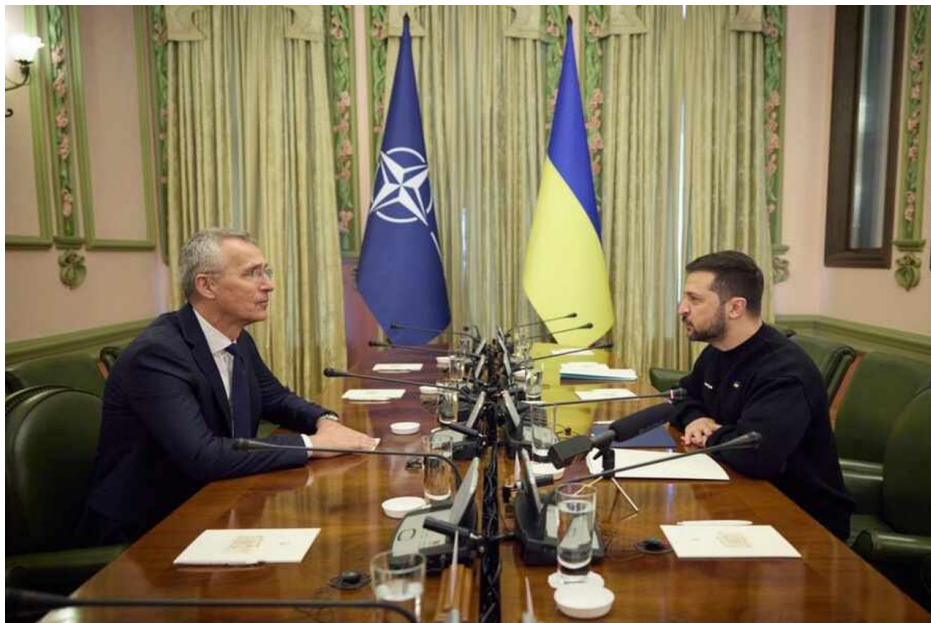
Zelenský bude skládat účty Jensu Stoltenbergovi, gen. tajemníkovi NATO

Protržená hráz Kachovky sice vymlela a odnesla ruská minová pole podél řeky, ale Ruská armáda nepokládá mini klasickým způsobem kopáním a zahrabáváním min, ale používá tzv. salvovou pokládku minových polí pomocí raketově pokládaných min. Ruská armáda k tomu používá MLRS raketový systém Tornado-S, který je odvozen od běžného salvového raketometu BM-30 Smerch.