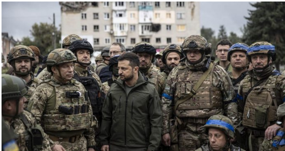
Ponurá nálada – Zelenský s generálem Syrským a vojáky. Válka brzy skončí u stolu a na druhé straně budou sedět Rusové s širokými úsměvy

Jenže proxy armáda Ukrajiny byla plnohodnotnou náhradou, která ale nesplnila cíle a úkoly, a to ani přes mamutí dodávky zbraní, munice a především peněz. Pád Zelenského s sebou smete i evropské politiky, od kanálu La Manche až po Humenné. Poválečná kocovina přivede k moci nové politické reprezentace, více založené na realpolitik koncepci.