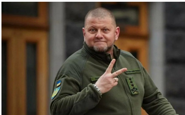
Valerij Zalužný, náčelník generálního štábu ukrajinské armády

Pokud se tato informace ukáže jako pravdivá, mohlo by se jednat o akutní zánět s přechodem do podbřišnice, což je životu nebezpečný stav a pokud tělo odmítlo falickou protézu, mohla vzniknout dokonce autoimunitní reakce. Počátkem dubna byl Zalužný na několika návštěvách bojových zón, nacházel se jak v Časově Jaru, tak i v Charkově a v Chersonu, kde chystal podmínky pro plánovanou ukrajinskou ofenzívu. Podle všeho byl zasažen šrapnelem do citlivých míst a přišel o penis. Náš kolega, lékař a spolupracovník redakce nám k tomu napsal podrobnosti.