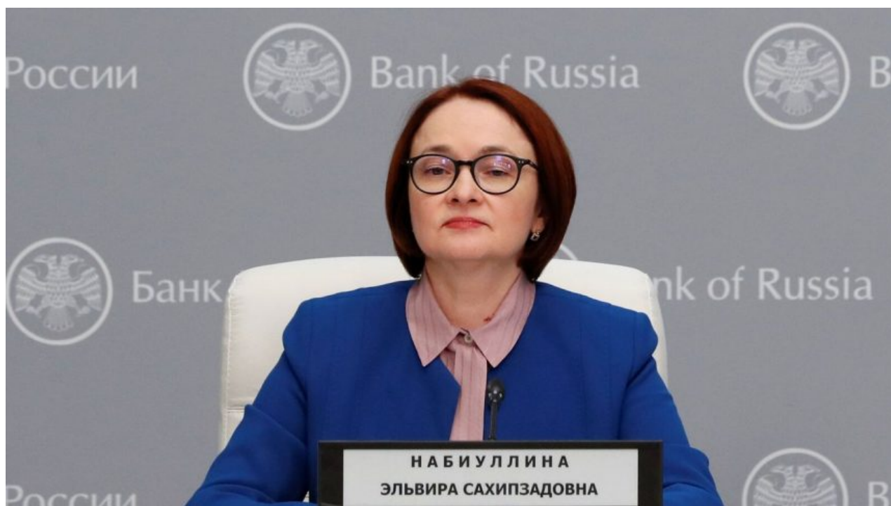
Elvira Nabiullina, šéfka ruské centrální banky

To znamená digitální rubl podle standardu CBDC stanoveného Mezinárodním měnovým fondem (IMF). Ano, je to IMF a tím je to dané! Chazarští a Chasidští v akci. Všichni Rusové dostanou po spuštění digitálního rublu přístup ke krypto peněženice, kterou si budou moci dobít částkou až 300 000 rublů měsíčně a převody mezi digitálními účty budou zcela zdarma a budou instantní, tedy okamžité. Už žádné čekání do druhého dne, žádné čekání na zaúčtování platební operace.