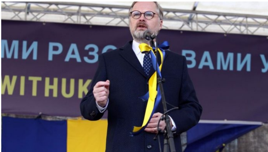
Petr Fiala na demonstraci "Stojíme za Ukrajinou"