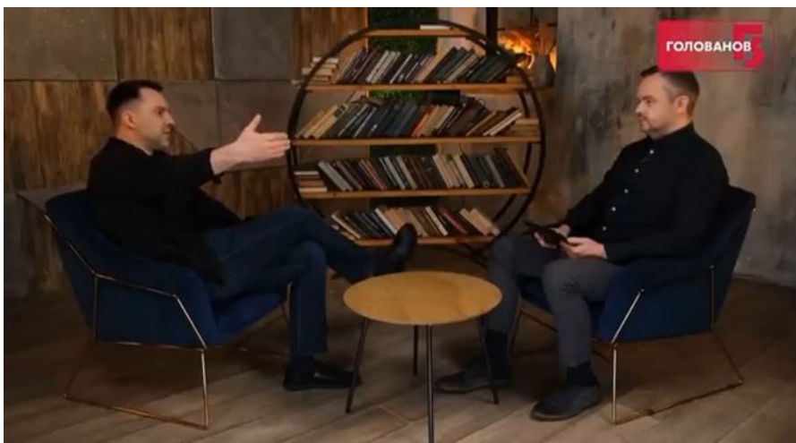
Alexej Arestovič s Vasilijem Golovanovem

podnicích těžkého strojírenství. Tito mobilizovaní zaměstnanci po nástupu na frontu začali pobírat v základu 120 000 (základní vzdělání a výuční list) a 130 000 (s maturitou anebo s VŠ diplomem) hřiven, tedy více jak 3 500 USD měsíčně.