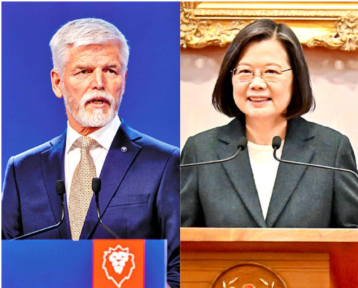
Petr Pavel a taiwanská prezidentka Tsai Ing-wen

Jedná se doslova o sabotáže českých investic v Číně ze strany vysokých českých politiků, což potvrzuje fakt, že tohle není česká vláda, ale vláda protektorátní, nepřátelská vlastnímu lidu a jeho zájmům a vůči majetkům vlastních občanů. Takže, nový prezident namísto toho, aby podporoval a chránil české investory v Číně, tak jim škodí a vystavuje je ohrožení svojí provokací s prezidentkou Taiwanu, zatímco na druhé straně by rád českým a tupým trumbellos zdanil nemovitosti. Nakonec to nemusí být jen jedna válka na Ukrajině, do které bude NATO zataženo, ale i válka na Dálném Východě na Taiwanu. A bude to ČR, která bude jedním ze strůjců takové války. Protože jak Rusko, tak i Čína je jaderná velmoc. S těmito politiky, kteří v současné době v rámci neoliberální vlny nastupují k moci v ČR a uchvacují moc, se nic jiného než katastrofy a války čekat nedají.