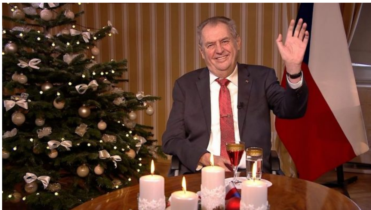
Prezident Miloš Zeman se loučí s občany po posledním vánočním projevu 26. 12. 2022