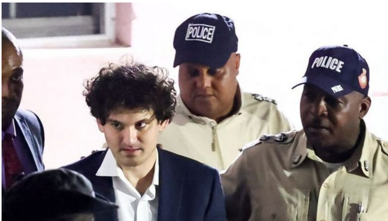
Zatčení Samuela Bankmana na Bahamách

Komu bude soud věřit? Mladému klukovi, který zpronevěřil miliardy dolarů, anebo tzv. hrdinovi a vůdci z Ukrajiny? Nad tím není vůbec potřeba přemýšlet. Deep State prostě zjistil, že vydání Bankmana-Frieda do USA mění situaci a může ohrozit vysoce postavené lidi v Deep State, na čele s šéfem Federální komise pro cenné papíry, který kryl podivnosti a nesrovnalosti u burzy FTX. Mopslík Zelenský prostě musel naklusat, musí ukázat cviky, které ho páníček naučil a za odměnu dostane opět nasypáno.