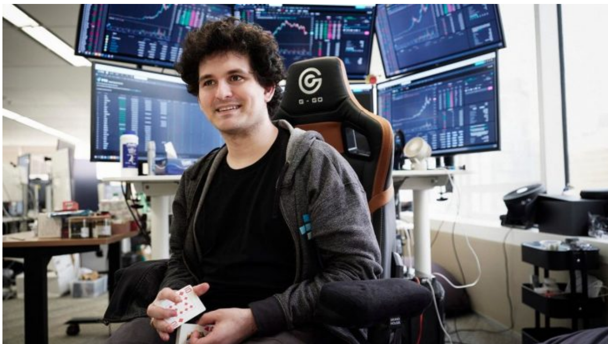
Burza FTX jela v cloudu... a teď jsou peníze v čoudu

Kyjev opět bude mít pocit, že dostává skvělou techniku, podobně, jako si to myslel, když dostával Javeliny, které se ukázaly jako nejméně spolehlivý protitankový systém v celé válce, protože poruchovost kompletů je tak vysoká, že Kyjev už o Javeliny ani vůbec nežádá. Američané buď Ukrajině dodaly vadné nebo prošlé komplety, anebo je někdo na Ukrajině očesal a prodal na součástky na Darknetu, takže vojákům na frontu došly nefunkční sestavy. Korupce je na Ukrajině největší právě v ozbrojených silách.