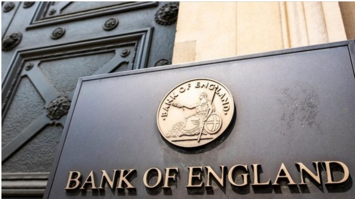
Bank of England

ČNB už nedokáže držet kurzy vůči EUR a hlavně ne vůči USD, a to vytváří situaci, že o pražskou Rothschildovu úložnu “ swap securities ” se najednou začínají zajímat žraloci a staví pozice proti koruně, to znamená půjčují si od brokerů koruny a tyto půjčené koruny prodávají na trhu za dolary. To vytváří pokles ceny koruny. Jakmile cena koruny padne, odkoupí koruny zpět za dolary, vrátí koruny brokerovi a rozdíl je obrovský dolarový vývar na účet české koruny a celé české ekonomiky. A že opravdu hrozí vlna short pozic proti koruně, to není třeba zdůrazňovat. Varování Nomury je tudíž další dílek do skládačky okolo spekulací a obav z měnové reformy.