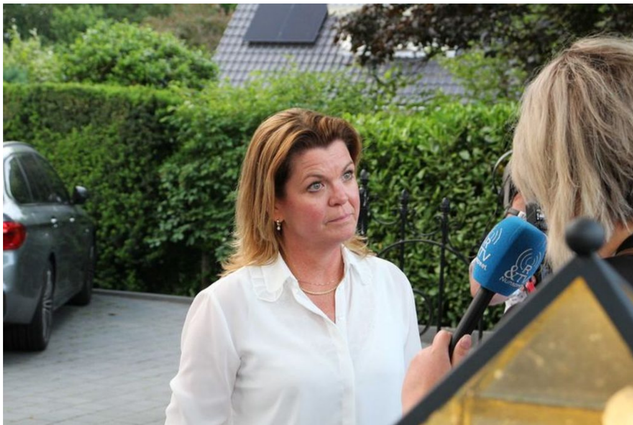
Christianne van der Wal, holandská ministryně pro dusík

Největší zemědělská lobbistická skupina LTO Nederland uvedla, že ji nejvíce znepokojují další omezení, kterým budou zbývající a nezlikvidovaní zemědělci čelit. Kromě toho plány na povolení většího kolísání hladiny podzemní vody budou mít dopad jak na zemědělce hospodařící na orné půdě, tak na chovatele hospodářských zvířat, uvedla LTO Nederland.