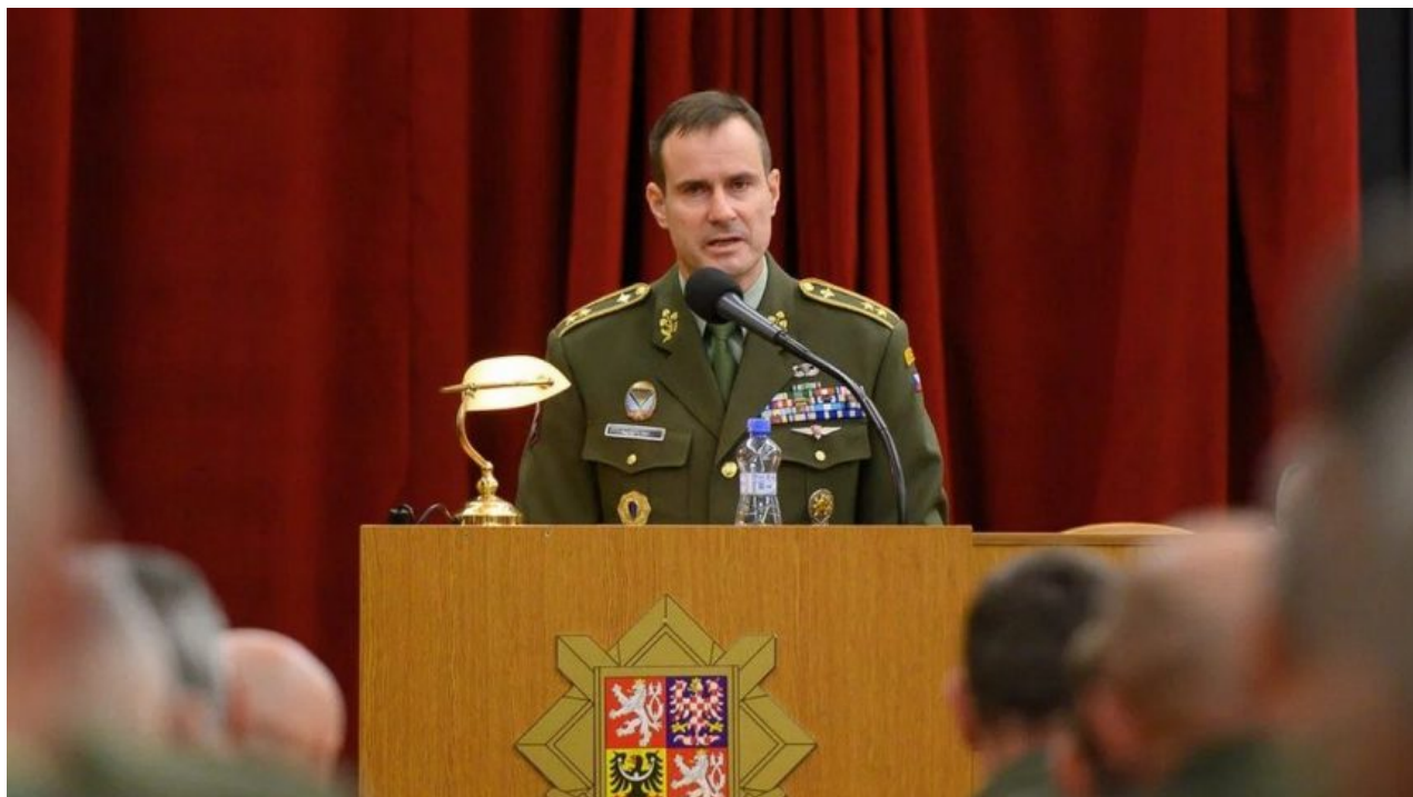
Náčelník generálního štábu AČR Genmjr. Karel Řehka

Přišel befel na zablokování Janečka, aby se nedostal do II. kola volby s Babišem. Počítá se totiž s tím, že když se do II. kola dostane Babiš s Pavlem anebo s Nerudovou, v obou případech Babiš prohraje. Ale kdyby volba probíhala mezi Babišem a Janečkem, volební téma by se z ideologie překlopilo do businessu, do otázek řešení inflace, vysokých cen energií a lidé by volili mezi dvěma oligarchy s nadějí, že jeden z nich napomůže vyřešit ty průsery, které za poslední rok nadrobila pětikoaliční vláda. Byla by to volba prezidenta proti pětikoalici.