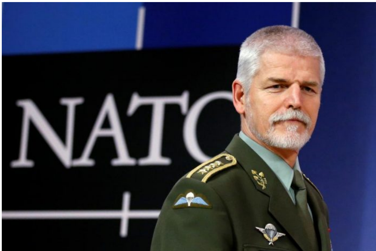
Gen. Petr Pavel

Je naprosto vyloučené, že by Janečka podporovali jen voliči z řad absolventů pomocných škol s dyslexií, kteří na petiční archy neumí správně napsat své nacionále. Ano, může se to z nepozornosti stát určitému promile petentů, z více jak 70 000 petentů může jít o desítky až nižší stovky petentů, ale ne o 35% podporovatelů v objemu prakticky 26 000 podpisů. To je prostě šílenství a naprostý nesmysl. Pokud se ukáže, že to opravdu tak je, potom je opravdu na místě obava, že někdo s petičními archy manipuloval a vyměnil je za archy s nesmysly, i když by to bylo opravdu na hraně. Mohlo by k tomu dojít při transportu archů na vnějšek, tzv. na cestě, anebo přímo na vnějšku.