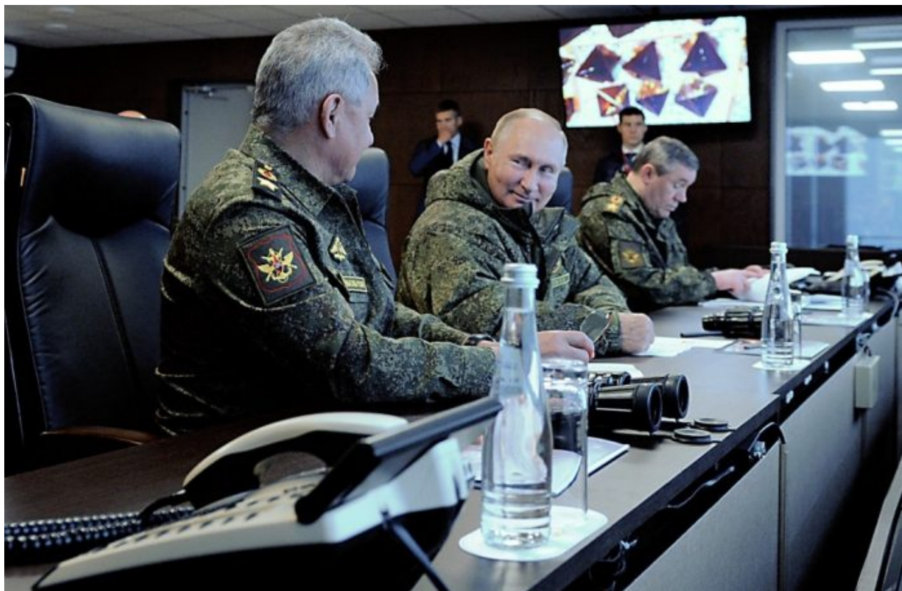
Zleva: Sergej Šojgu, Vladimir Putin a náčelník GŠ ROS Valerij Gerasimov

Současné útoky Ruské armády na energetiku Ukrajinu vyženu z ukrajinských měst většinu obyvatel, aby po zahájení ofenzívy byly při úderech na města co nejmenší civilní ztráty. Většina Ukrajinců prchne na západ Ukrajiny a odtamtud do Evropské unie. Ukrajina potřebovala zimní přestávku, aby se mohla na jaro znovu vyzbrojit, ale Surovikin tento čas Ukrajině neposkytne.