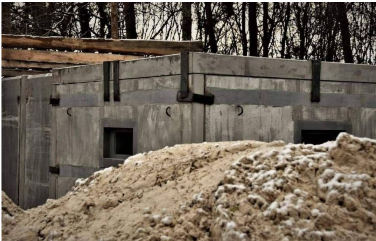
Narychlo budované bunkry severně od Kyjeva

Ruská armáda navíc provádí 6-týdenní výcvik mobilizovaných branců a poslední mobilizovaní byli odvedeni 31. října, o čemž informovala i ruská média. To znamená, že výcvik mobilizovaných skončí okolo 14. prosince, kdy budou všichni vycvičeni. Od té chvíle a od toho okamžiku bude tedy celá armáda 300 000 mobilizovaných mužů k dispozici.