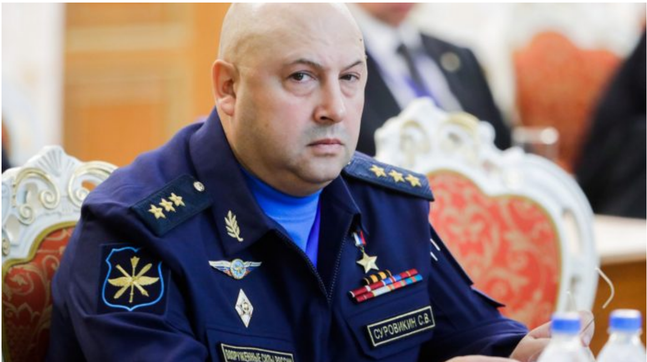
Gen. Sergej Surovikin

Pokud by se jednalo o přípravu na jarní operace, logicky by stroje nebyly natírány bílou kamufláží, takže tyto přesuny potvrzují, že generál Sergej Surovikin rozhodl o zimní ofenzívě, která zřejmě bude realizována na 3 frontových liniích, přičemž dojde s vysokou pravděpodobností k obnovení dvou front, které Ruská armáda na jaře otevřela, ale potom bez vysvětlení zase uzavřela. Prakticky s jistotou můžeme prohlásit, že dojde k zahájení ofenzívy na Charkovském frontu. K hranicím z ruské strany míří tisíce kusů těžké vojenské techniky, video nahoře zachycuje zimní ruské tanky mířící z Voroněže k hranicím Charkovské oblasti. Charkovská fronta bude tedy jistě znovu otevřena.