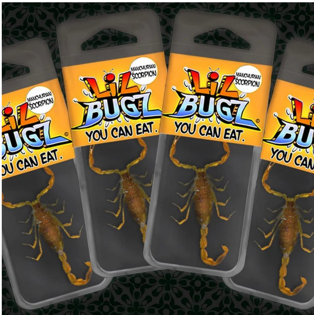
Pražení škorpioni. Dobrou chuť...

Lidé přestanou kupovat maso, a ne kvůli tomu, že by jim přestalo chutnat, anebo se stali fanoušky hmyzích burgerů, ale kvůli tomu, že na to tradiční jídlo lidé nebudou mít peníze, protože v tradičních potravinách, v každém rohlíku a másle, bude jako rakovina okopírována cena enormně drahé a nedostatkové nafty do nádrží zemědělských strojů a kamionů, které ty potraviny na polích vyrábějí a poté kamiony dopravují z velkoskladů do supermarketů po celé Evropě. Pamatujte, že konceptuální gramotnost znamená, kromě jiného, schopnost všimnout si fragmentů konceptuálních událostí a