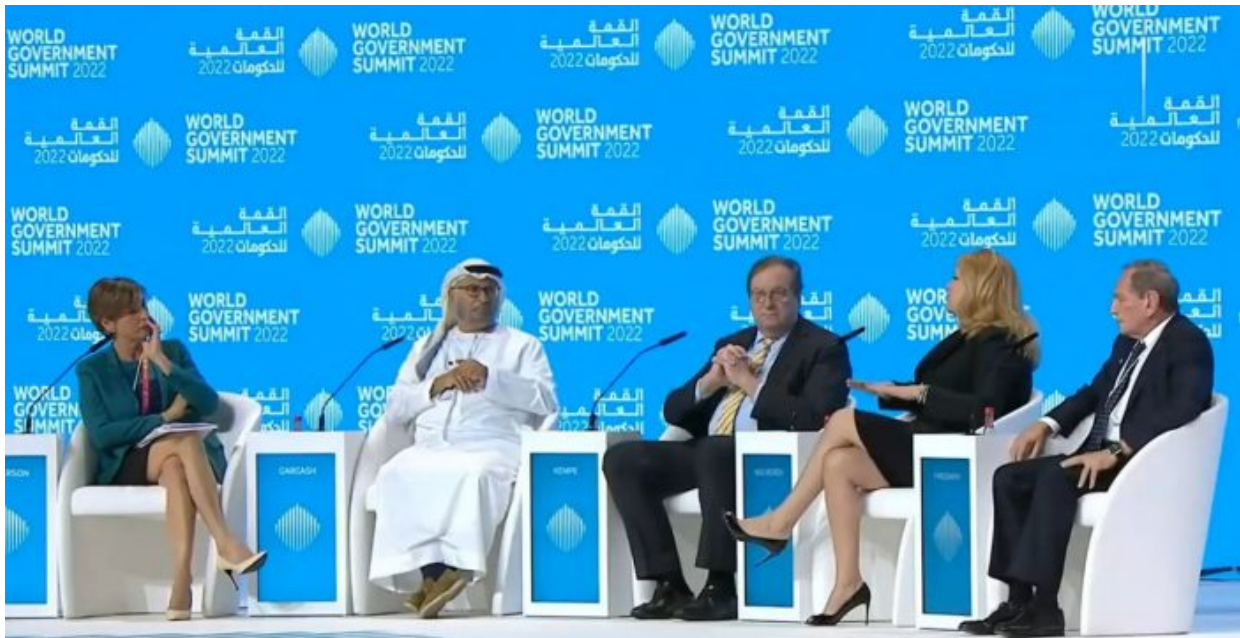
Pippa Malmgren v panelu summitu WGS 2022

Ano, je to venku! Krach FTX byl od počátku plánován jako Black Swan efekt na zničení důvěry investorů v decentralizované a neregulované crypto a současně v tom samém okamžiku mělo být investorům nabídnutou řešení, investování do digitálního dolaru, tedy do centralizovaného crypta pod kontrolou FEDu!