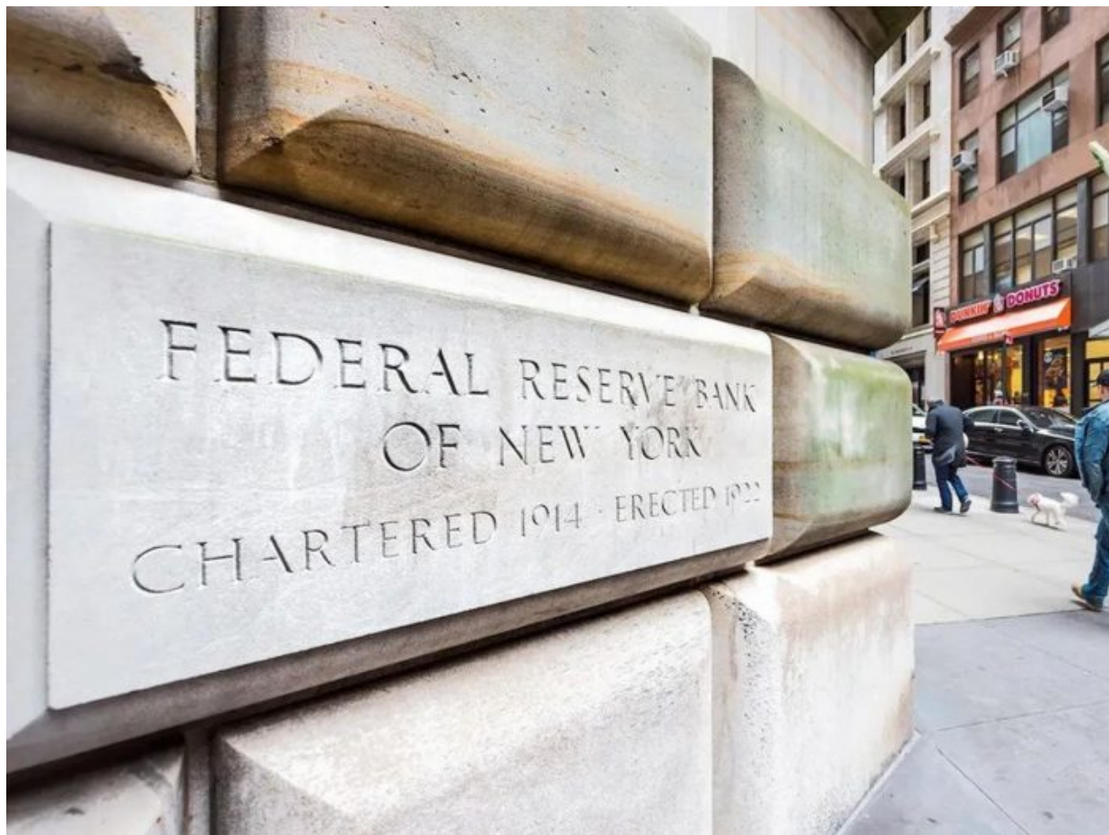
Budova FEDu v New Yorku

v mobilech, přičemž tyto digitální měny nebudou mít občané ve vlastnictví a v držení, protože budou mít podobu běžných účtů, i když založených na blockchainu, který bude centralizovaný.