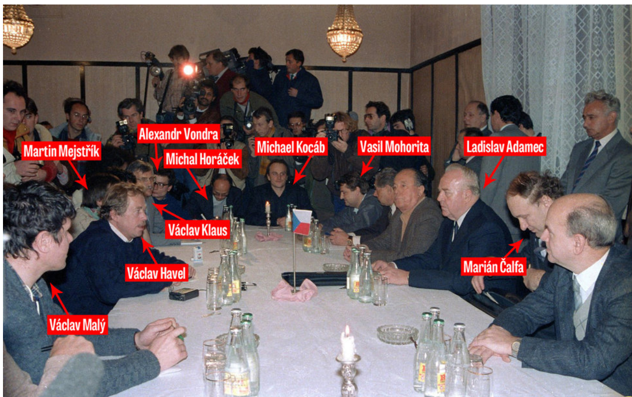
Teatrální předání moci v Československu. Vlevo řízená opozice v čele se zaměstnancem pivovaru Václavem Havlem, vpravo komunistická vláda Ladislava Adamce. Komedie, která přepsala dějiny