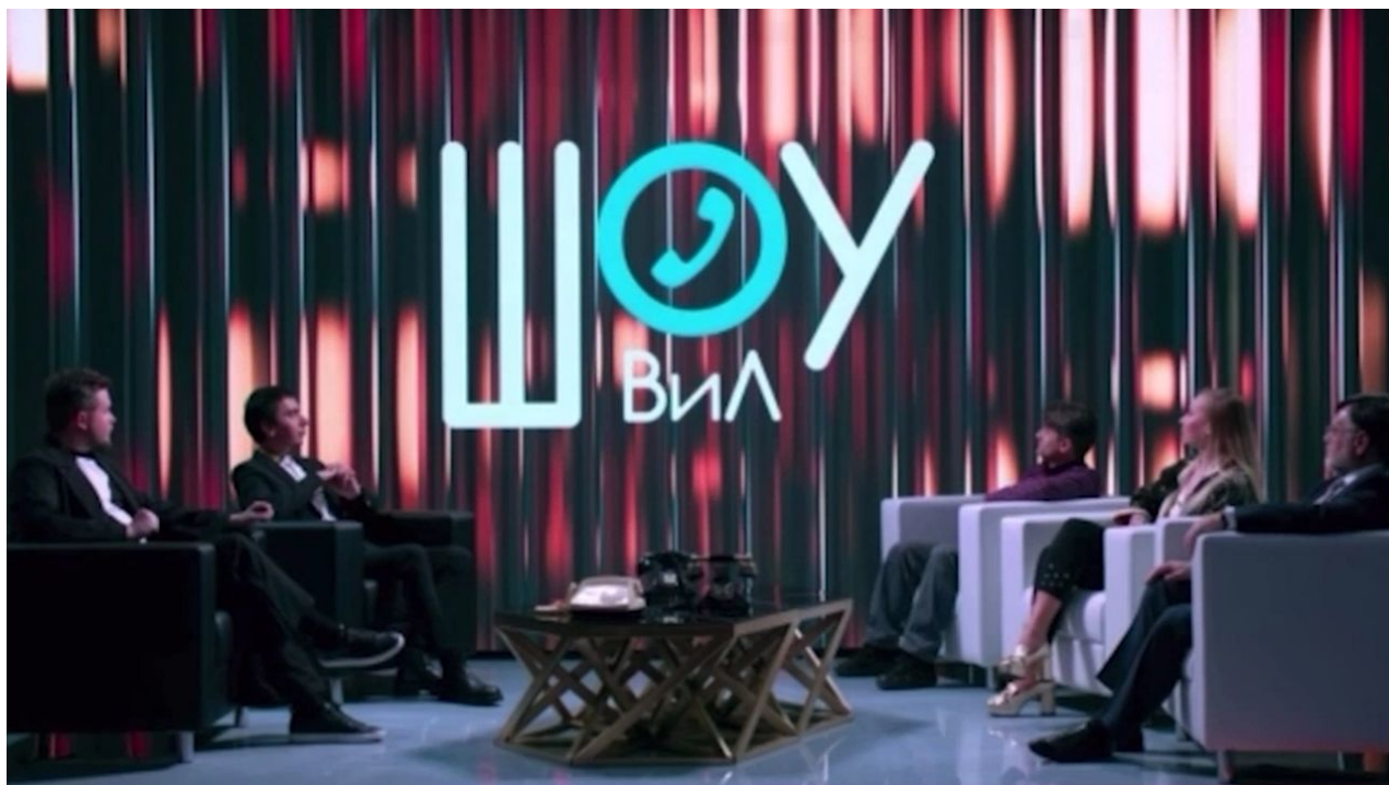
Show V&L – Reality show Vovana a Lexuse, kde představují své úlovky a natočená vide

Zakopala se na Donbasu, prošla výcvikem NATO a dnes musí Rusové těžce bojovat o to, co Igor Girkin Strelkov se svojí armádou v roce 2014 a Alexander Zacharčenko v roce 2015 mohli získat snadno a rychle. A je neuvěřitelné, že česká vláda celých 8 let podporuje Kyjev, když ten nikdy ve skutečnosti o mírové vyřešení konfliktu na Donbasu neusiloval. Ale není se čemu divit. Historie kabátového převratu je kapitolou samou pro sebe.